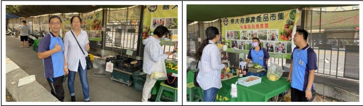
19. 112 年 9 月份，辦理「嘉大有機農產品市集」，共 4 場次計 56 攤次。