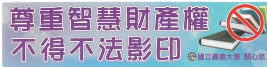
圖 1 張貼於影印機、印表機及多功能事務機