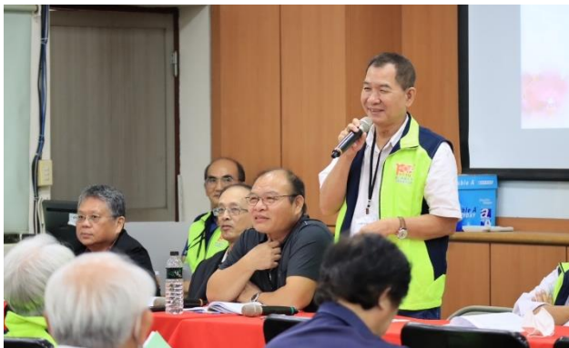
系友會員大會現場