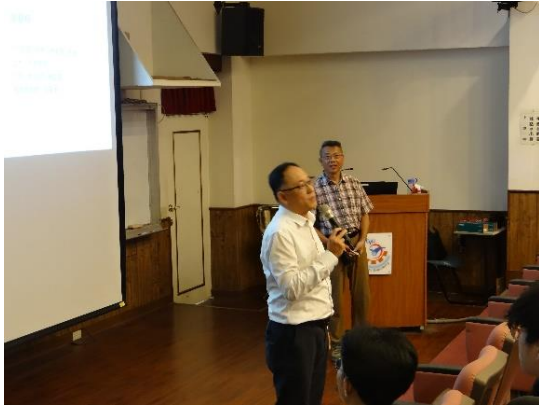
林庚達老師介紹講師