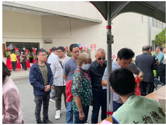
系友大會會員報到現場