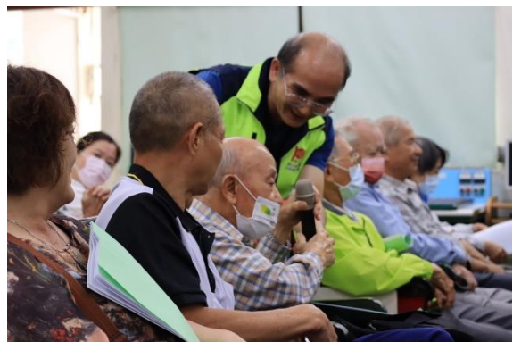
系友會員大會現場