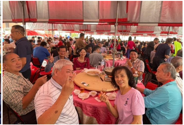
會員大會餐敘現場