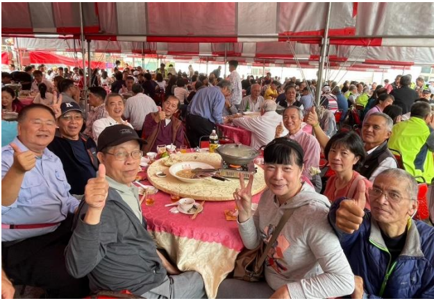
會員大會餐敘現場