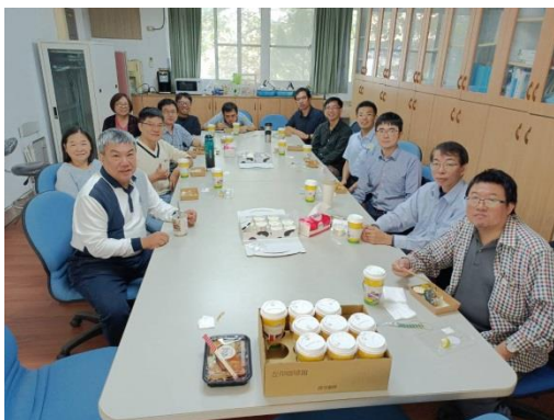
中午時間與演講者進行交流。

1. 2024年11月27日應用化學系舉行專題演講，邀請國立彰化師範大學化學系高琨哲教授蒞臨，以「Light-assisted Heterogeneous Catalysis Using Plasmonic Nanostructures」為題進行演講。