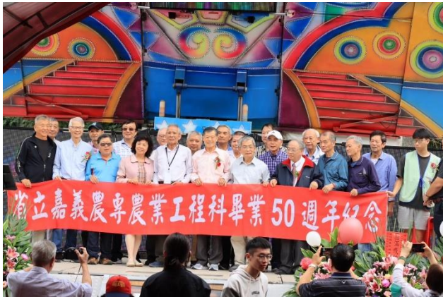
系友畢業50週年紀念合影