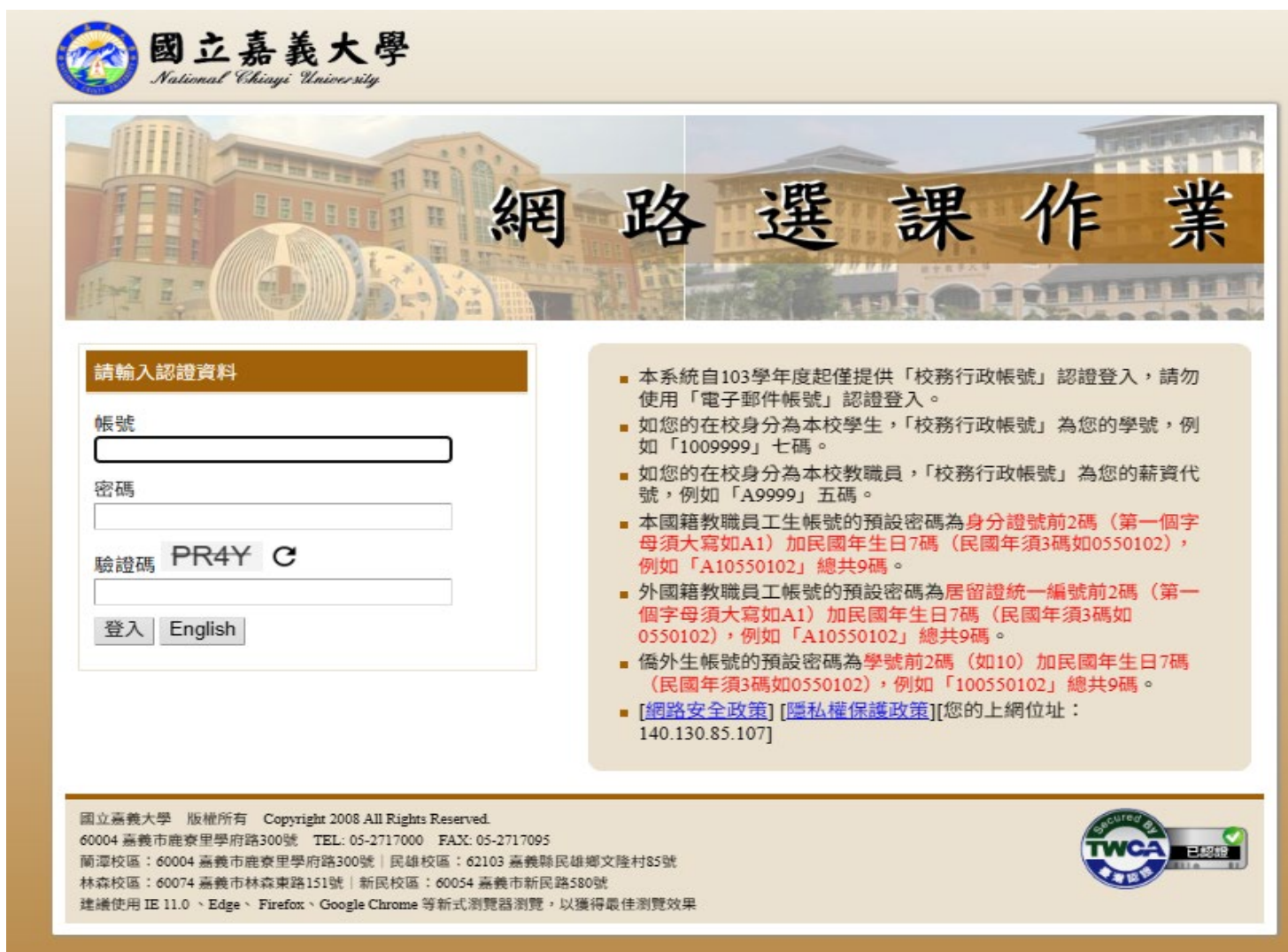
圖三：登入網路選課作業