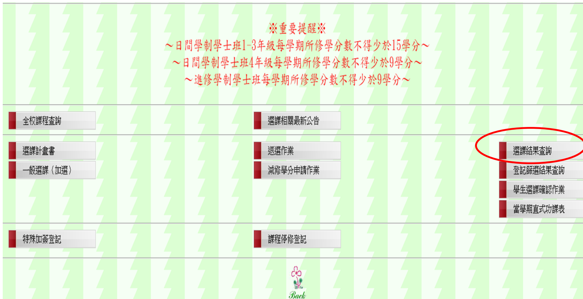
圖十六：選課結束後請務必查詢選課結果，確認截至目前為止全部選課結果