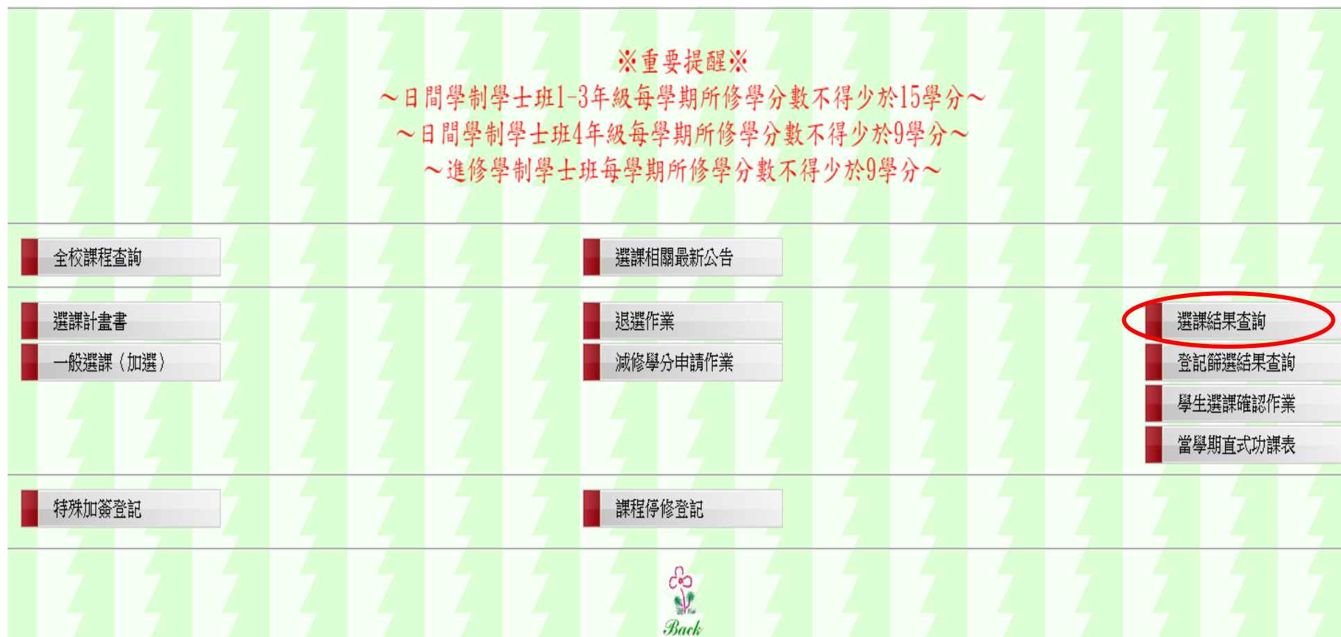
圖十六：選課結果查詢