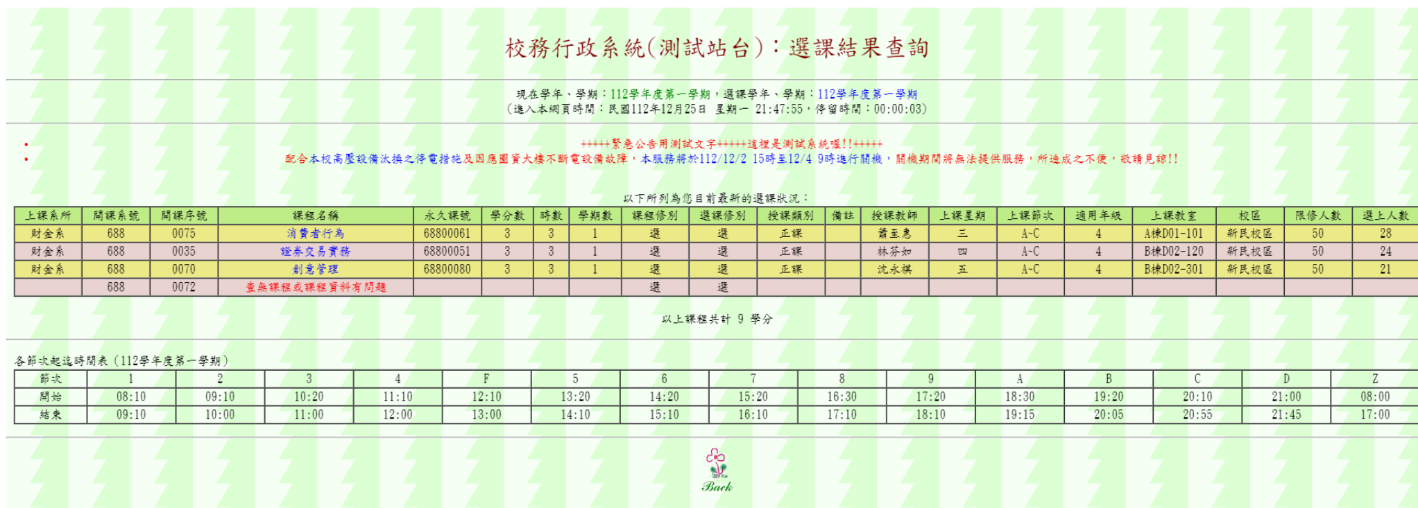
圖十七：選課結果查詢