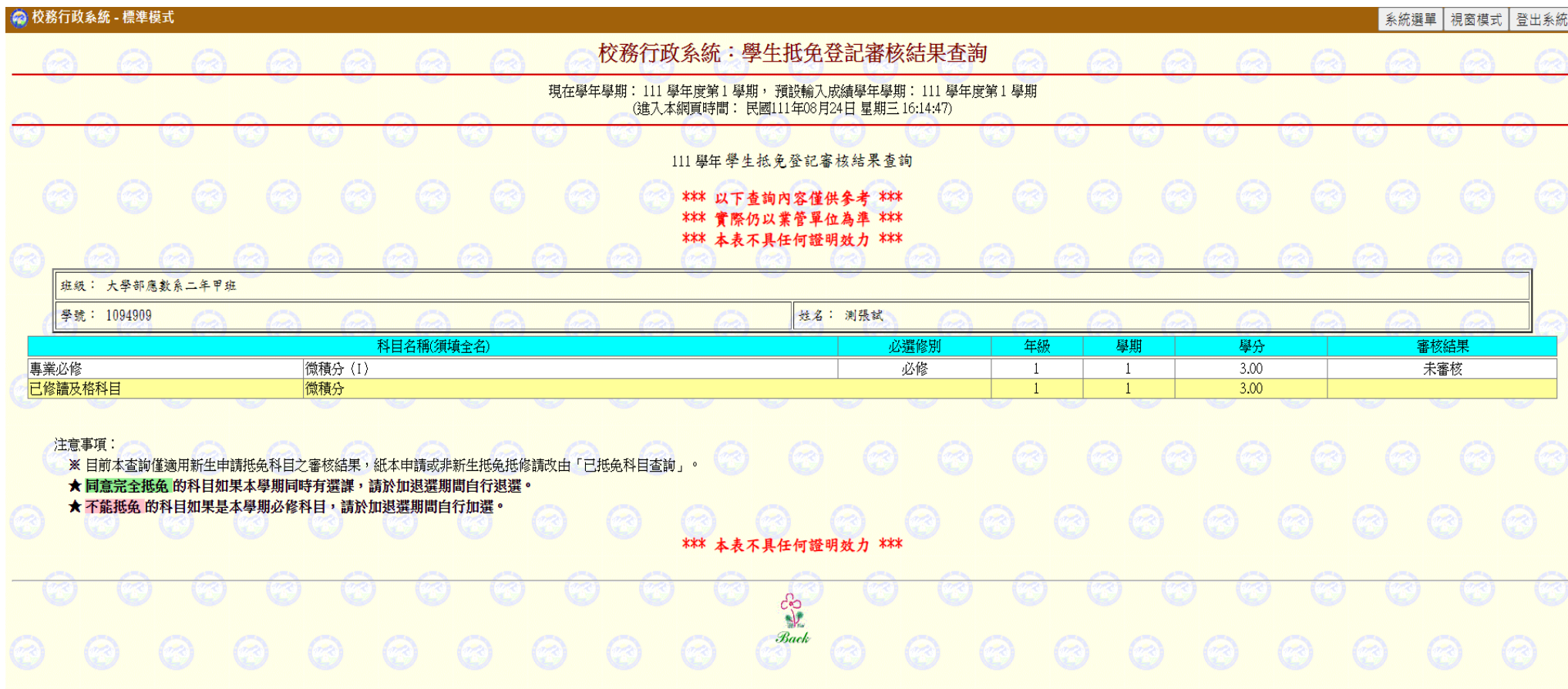
圖十五：查詢新生抵免審核結果