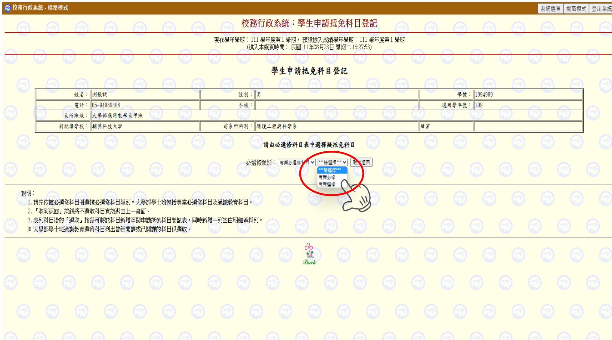
圖八：請選擇必選修類別