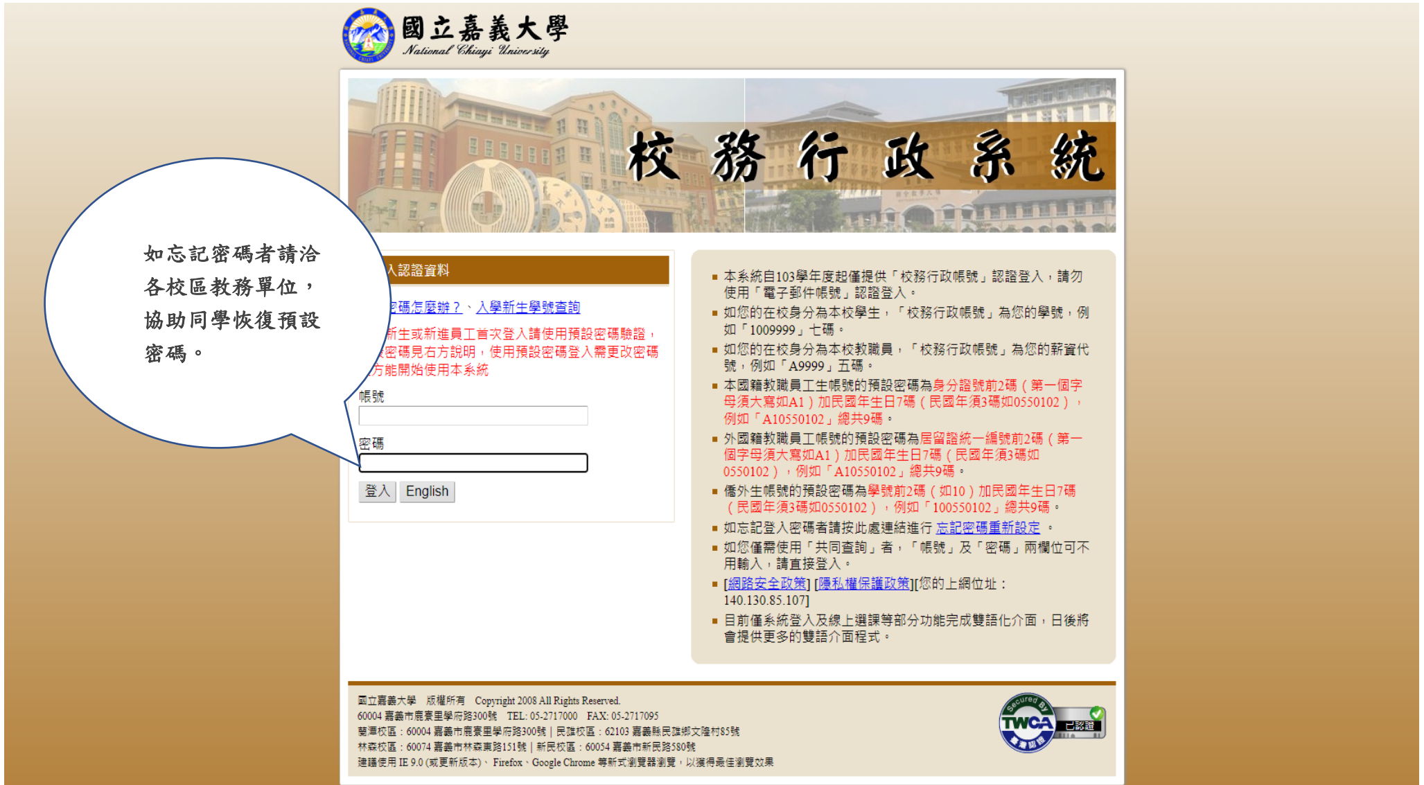
圖三：登入校務行政系統