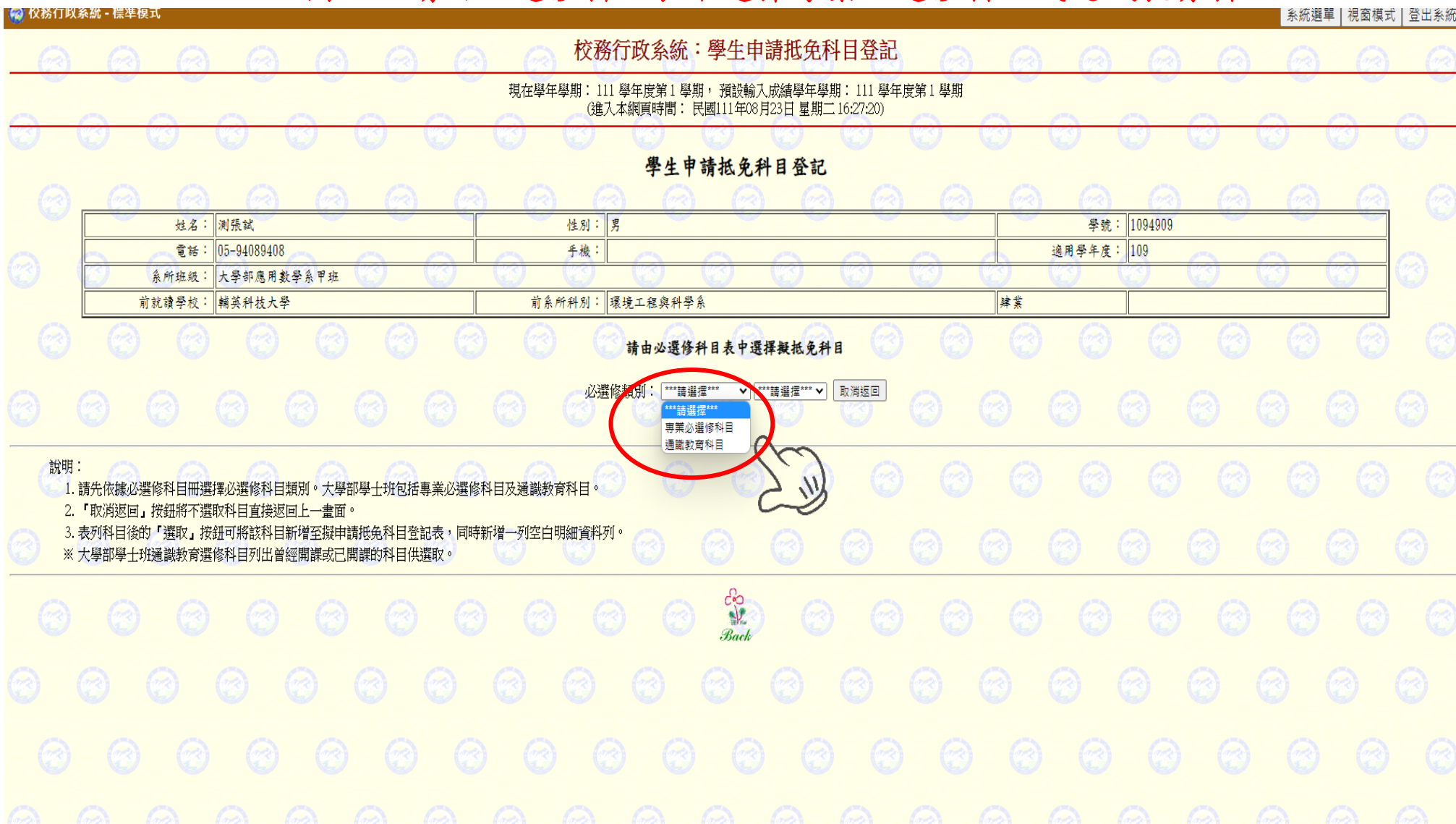
圖七：請由必選修科目表中選擇專業必選修科目或通識教育科目