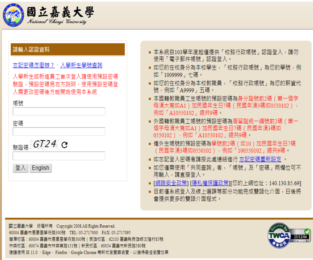
圖三：登入校務行政系統