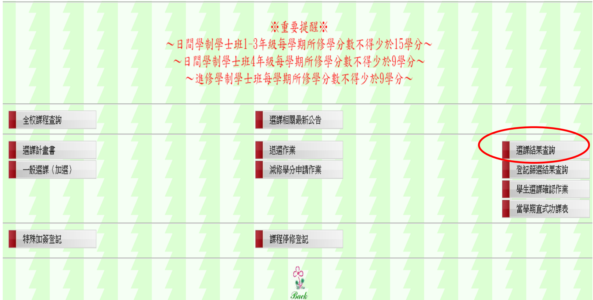
圖十八：選課結束後請務必查詢選課結果，確認截至目前為止全部選課結果