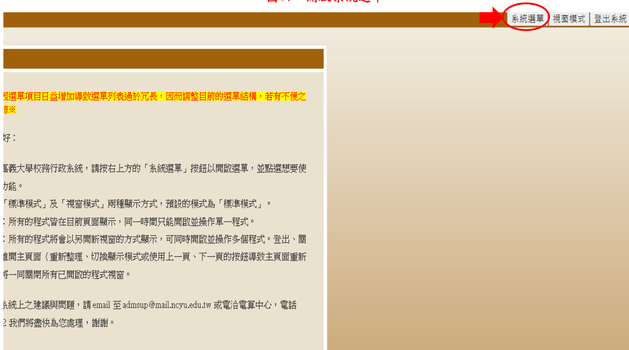
圖四：開啟系統選單