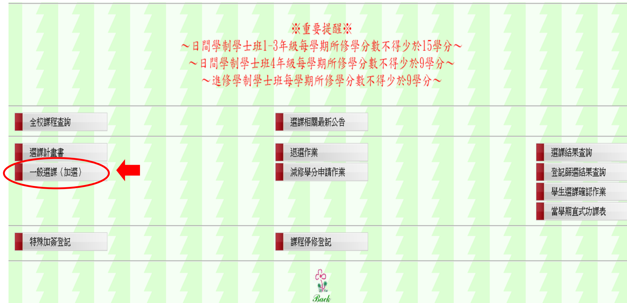
圖七：進入「一般選課」(加選)

選課系統會將同學班級專業必修科目自動匯入選課系統，選修科目則由學生自行加選，但轉學生入學第一學期及提早入學研究生不會自動匯入必修科目，請自行檢視及加選欲選修之必選修科目。