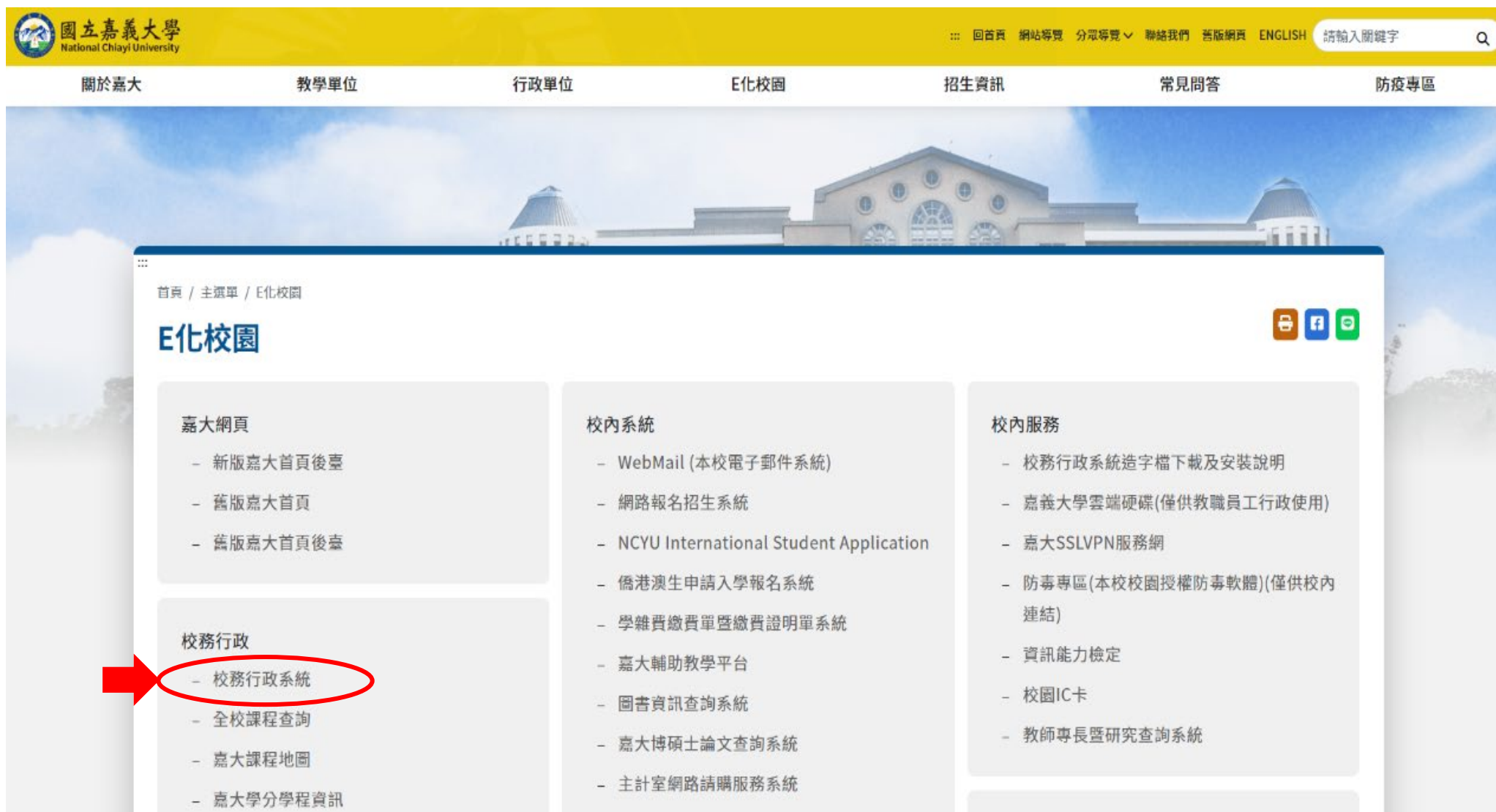
圖二：點選校務行政系統進入