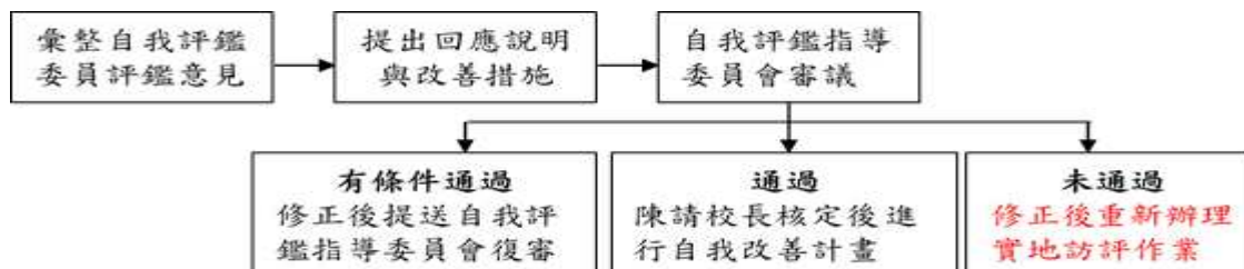
圖 3 本校校務自我評鑑認可結果與處理方式說明

針對自我評鑑委員提出之評鑑意見，本校校務評鑑執行委員會及自我評鑑工作小組先行提出回應說明與具體改善措施，補充相關資料並修正報告書後，將自我評鑑報告書（修正稿）提送自我評鑑指導委員會審議並確認自我評鑑結果。自我評鑑認可結果分為「通過」、「有條件通過」及「未通過」三種結果，三種認可結果之處理方式如圖 3。