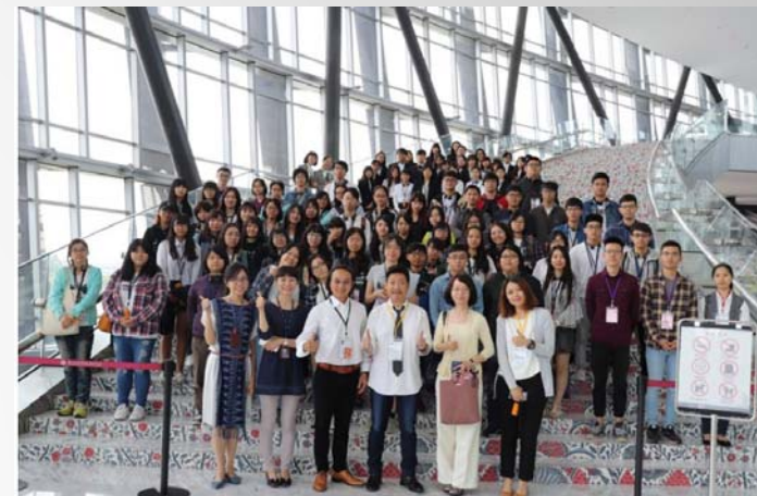
與故宮南院合作之博物館人才培育合作計畫