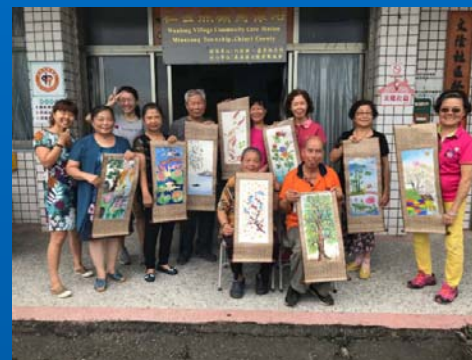
研究生教導社區創齡畫室