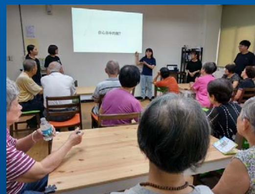
學生團隊教樂齡長輩學藝術