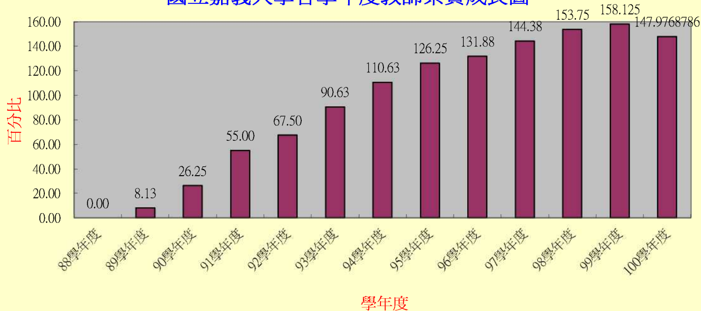
國立嘉義大學各學年度教師素質成長圖