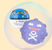
寶可夢PU捏捏球 +公仔筆套(款式隨機)