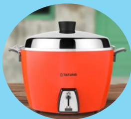
大同10人份電鍋 (售價:$3,390)