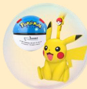
寶可夢書包吊牌 +公仔筆套(款式隨機)