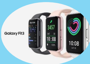
三星Galaxy Fit3 智慧手環 (售價:$2,680)