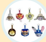
動物方程式毛絨 掛件盲盒(款式隨機)