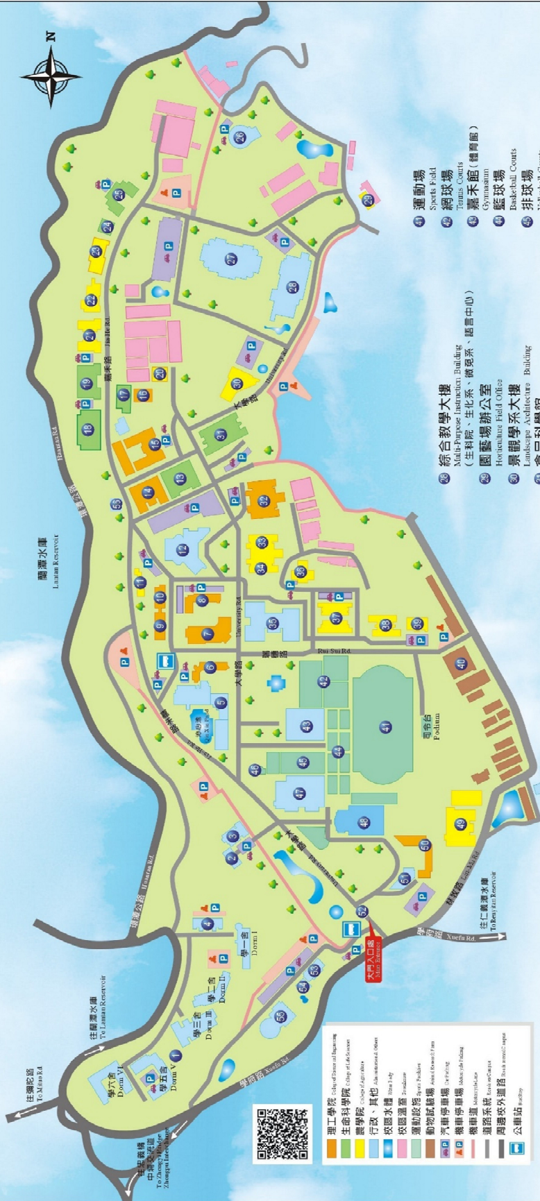
Map of Lantan Campus, National Chiayi University