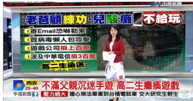
不滿父親沉迷手遊 高二生癱瘓遊戲 | 中視新聞20170711

侵入或攻擊網站，刪除、變更或竊取相關資料；刑法「妨害電腦使用罪」章，針對無故入侵電腦、無故取得刪除、變更電磁紀錄、無故干擾他人電腦及製作專供電腦犯罪之程式等行為予以處罰，將電腦安全、電磁紀錄之支配及電腦運作效能等法益正式納入刑法保護。