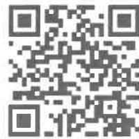
城市科學實驗室官網