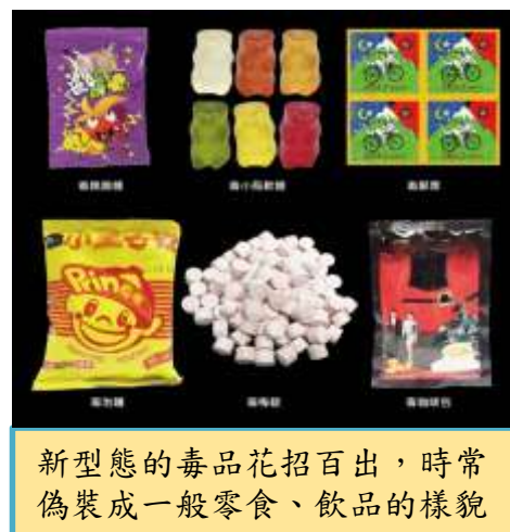
新型態的毒品花招百出，時常偽裝成一般零食、飲品的樣貌

一、近年來新型態的毒品花招百出，時常偽裝成一般零食、飲品的樣貌，意圖誘使青少年嘗試或誤用。臺北市警察局少年警察隊表示，接觸毒品不但違法也將造成身體永久性的健康危害，提醒學生要對來路不明的食品提高警覺，也不要輕易食用陌生人給予飲料或食物，以免誤觸毒品。新興毒品價格便宜，加上可愛花俏的包裝設計，偽裝成小熊軟糖、巧克力或咖啡包等常見食品，容易讓青少年失去戒心。但