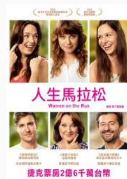
人生馬拉松 捷克語配音 | 普遍級