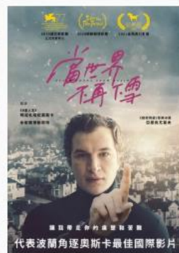
當世界不再下雪 波蘭語配音 | 輔12級