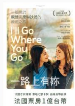
一路上有你 法語配音 | 普遍級