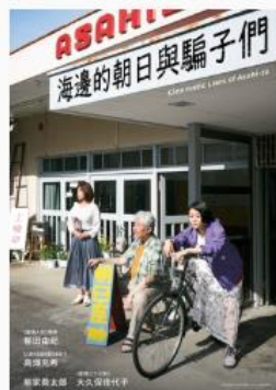
海邊的朝日與騙子們 日語配音 | 普遍級