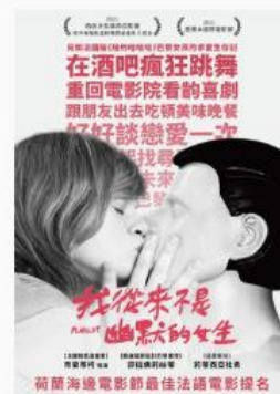
我從來不是幽默的女生 法語配音 | 輔12級