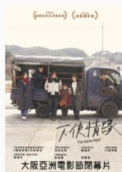
天使情緣 日語配音 | 保護級