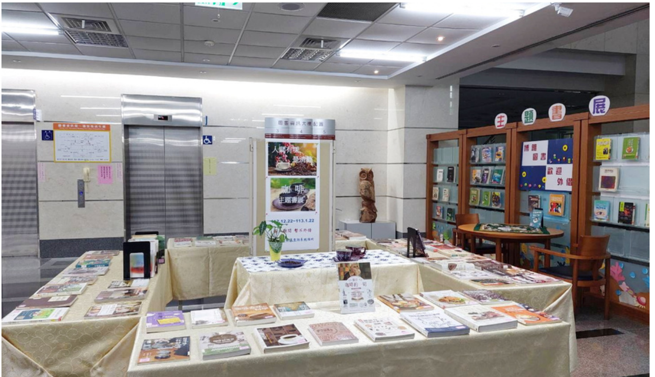
圖:嘉大圖書館於一樓陳列與咖啡主題相關的書籍供大家閱讀。