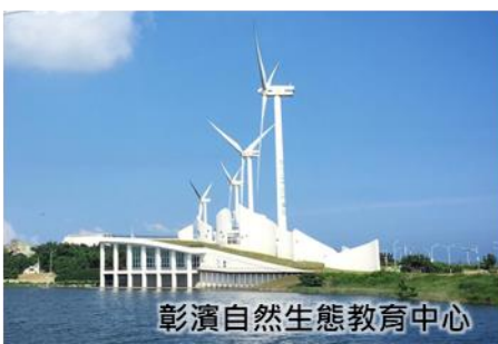
彰濱自然生態教育中心