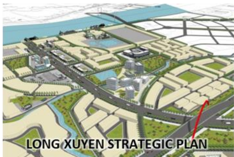
LONG XUYEN STRATEGIC PLAN