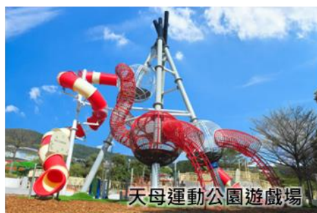
天母運動公園遊戲場