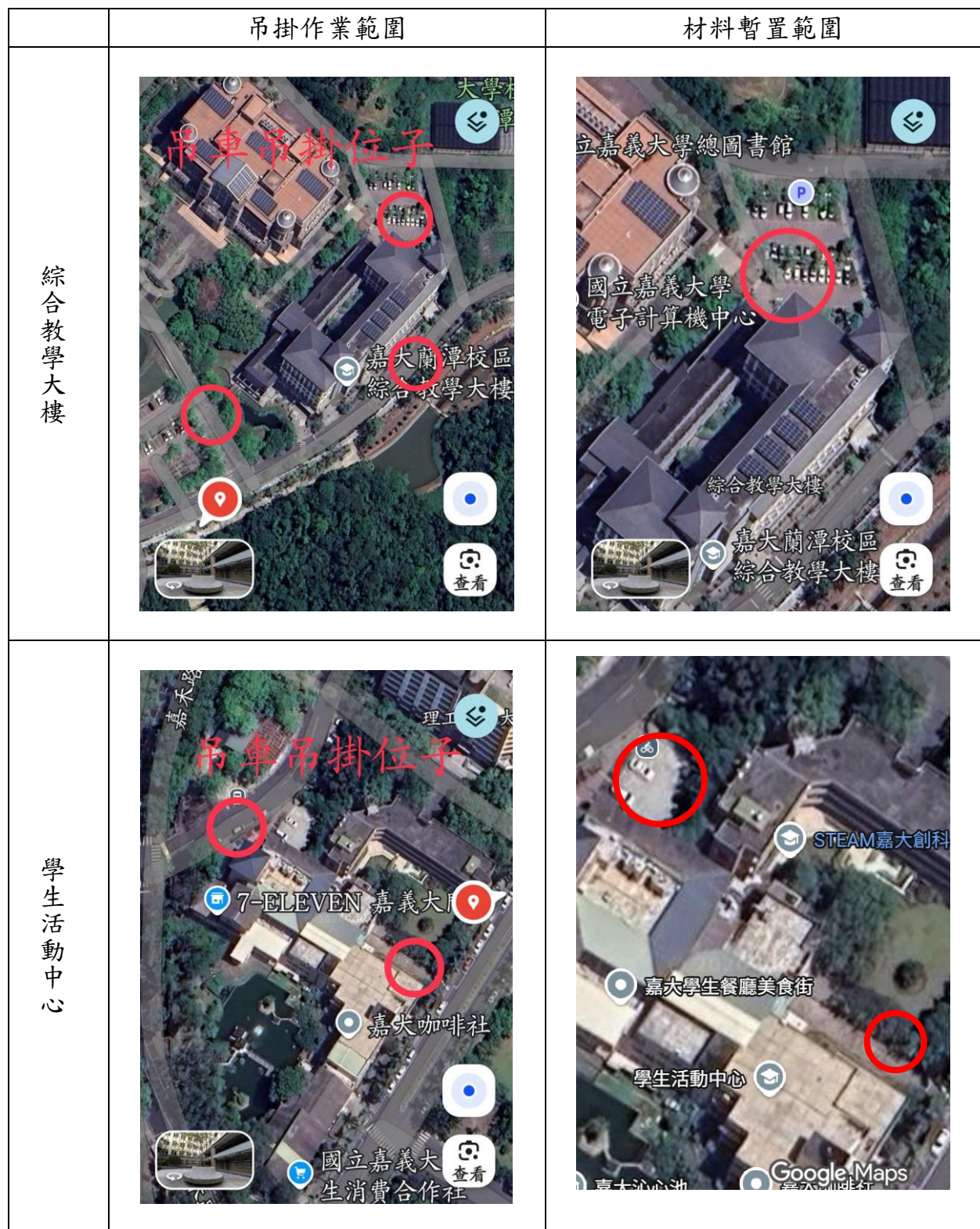
吊掛作業及暫置範圍位置示意表