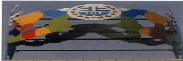
▲由側面可見人形同心合力拱起校徽