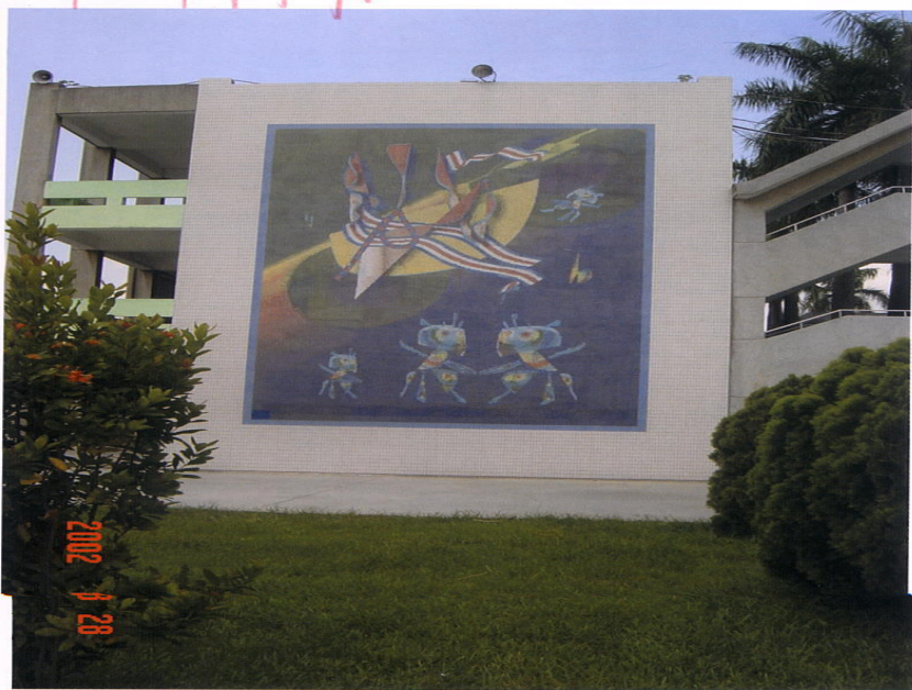
▲「希望工程——航向新星」堪稱國內最精密的馬賽克鑲嵌畫