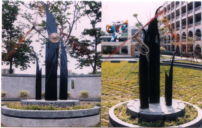
▲座落於中庭綠地的「泳樂」，是以舊樂器組合金屬條來呈現的音樂的另一種存在方式