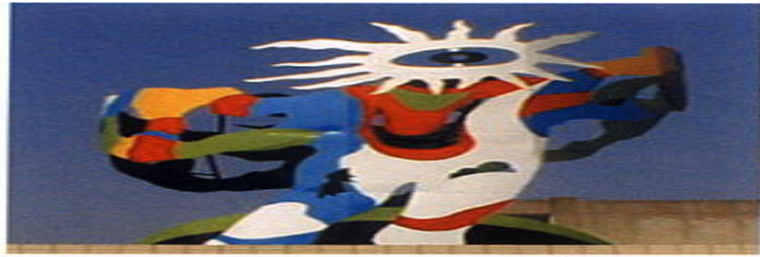
▲祈舞以人形舞動為創作