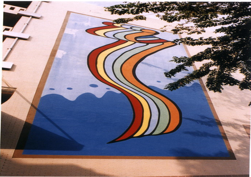
▲如彩虹圖像游龍般的圖案，象徵鑽游穿透逆境，向上攀升的希望