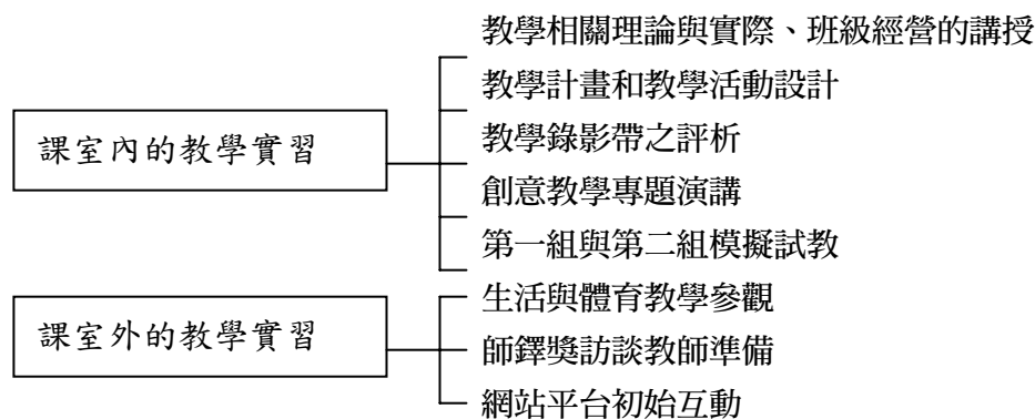
圖3. 第一階段行動研究之內容

從2月25日至4月1日為第一階段，在此階段的活動包括：教學活動設計與教案的撰寫，以及班級經營的分享、教師專業發展等探討、教學錄影帶之評析、創意教學專題演講、第一組與第二組模擬試教、師鐸獎教師訪談準備、網站平台互動，如圖3。