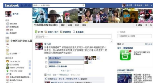
圖 1 FB 秘密社團--小麋斑比的秘密花園