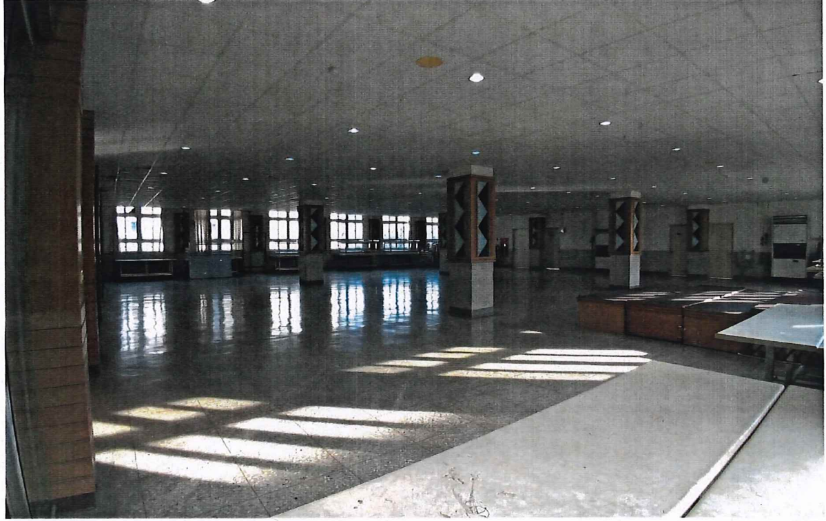
圖一(學生餐廳三樓)