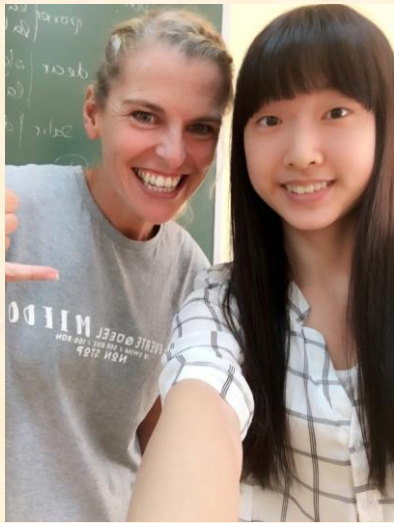
與很有活力的西班牙文老師合照

到韋爾瓦大學的交換學生選課十分彈性，只要是你想選的並且沒有衝堂的問題，在人數額滿前都可以選，我是選擇了與我本科系相關的商管課程修讀，再加上一門初級西班牙文課，總共修了 24ECTS。沒有把課表填很滿因為我在本來的學校學分沒有很缺，也不希望把全部的時間都拿去上課，因此只有選我很有興趣的課修讀。