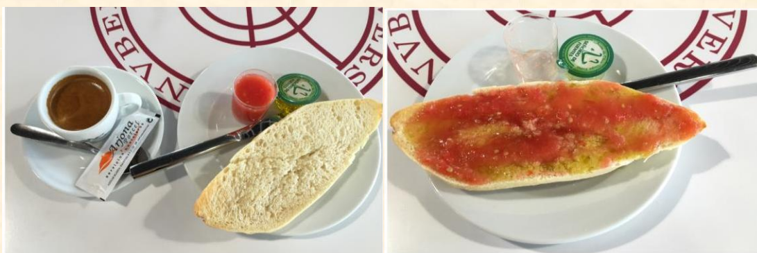
傳統西班牙式早餐：一小杯濃咖啡＋烤麵包抹初榨橄欖油加蕃茄泥