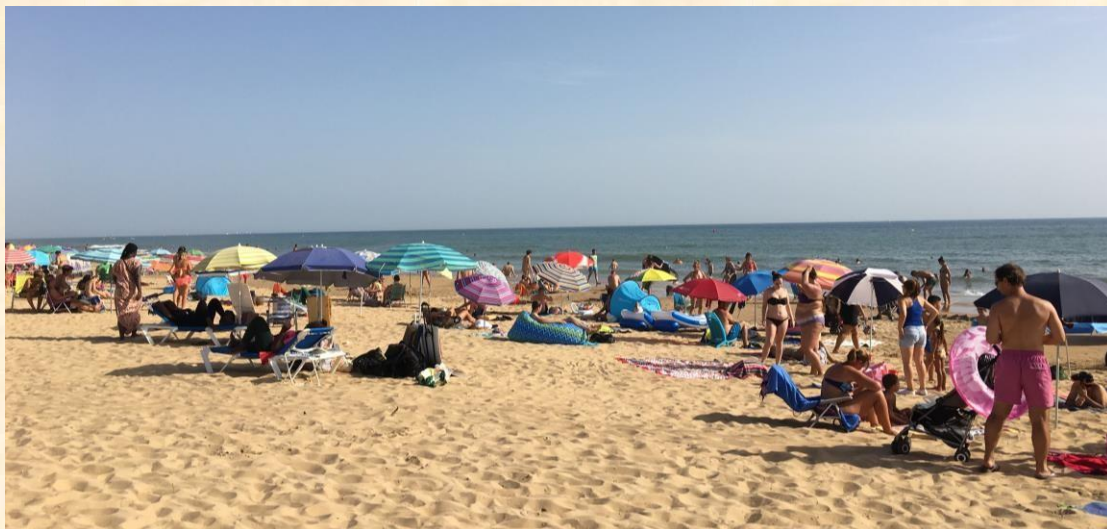
韋爾瓦很美麗的海灘