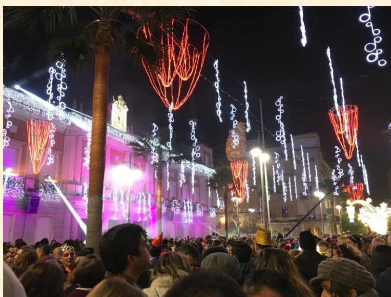
跨年夜盛況—隨最後的鐘響吞12顆白葡萄是西班牙很特別的慶祝方式