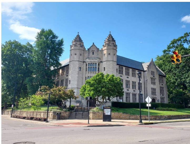
Jones Hall, Youngstown State University