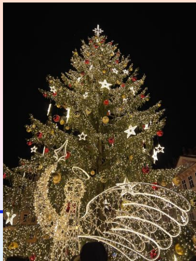
◀ 維也納市政廳廣場聖誕市集燈飾