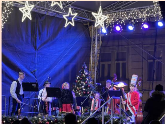
◀ 市集中的表演節目