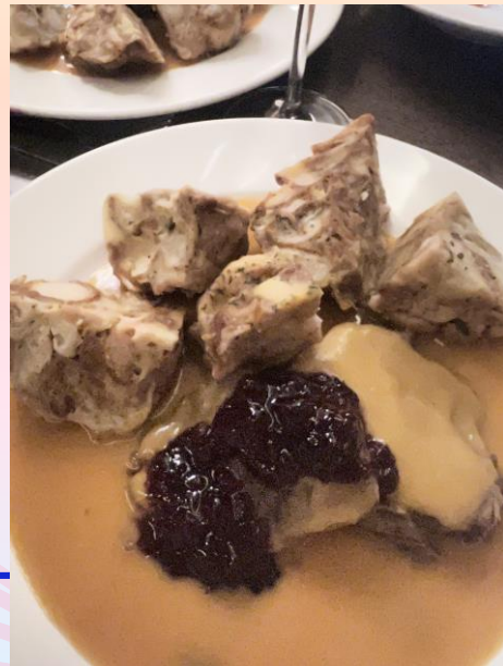
> svíčková na smetaně 奶油牛脊肉