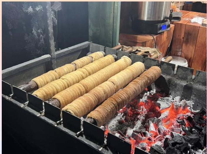
< Trdelnik 肉桂捲