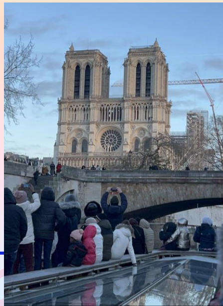
> 遊船時經過巴黎聖母院