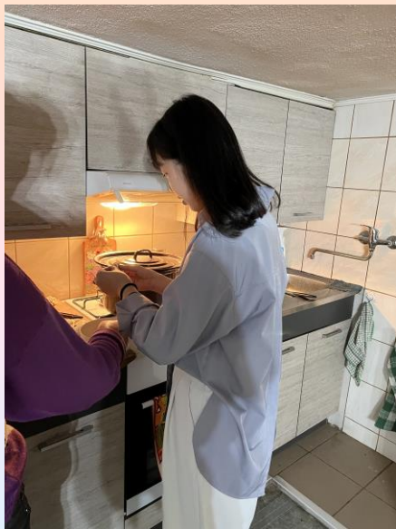
製作斯洛伐克餃子