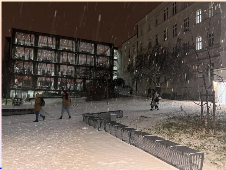
< 人文學院冬日傍晚雪景

除了上課遇到的各種問題，在學校設施上也有遇到一些問題，像是因為上課時間更改的原因，原本的教室不能使用，所以大多都在學校的團體討論室上課，但因打開教室需要使用教師卡，常常遇到已經預約教室，但是嗶卡後仍然無法打開教室的問題，需要請學生和我到相關的處所說明情況後租借鑰匙，教室內的HDMI線有幾條也已經老舊需要更換，這一點讓我覺得學校端應該可以多加改進，我也很感謝我的學生願意幫我和相關人員溝通，讓我可以順利上課。