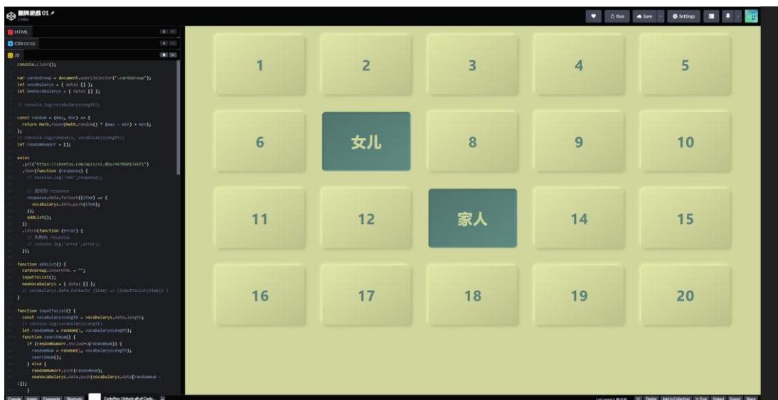
圖 3-2：非主修學生的現代漢語教學《一》上課時使用的翻牌遊戲

課程中使用的教材以簡報為主，影片為輔。透過圖片搭配生詞的方式，加深對生詞的印象。也藉由課本中的對話，讓學生進行角色扮演，嘗試應用所學。另外，顧慮到長時間學習不熟悉的語言會讓學生感到疲倦，因此課堂中會穿插中文歌或相關影片，讓學生放鬆並打起精神。