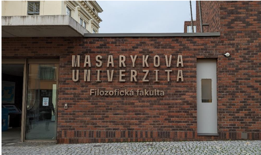
圖 2-1：馬薩里克大學藝術學院