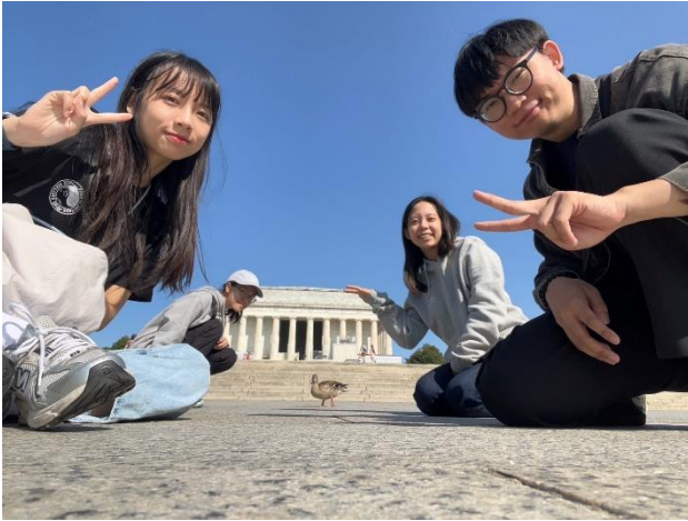
華盛頓 林肯紀念堂