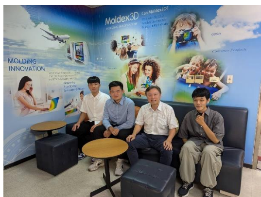
圖五 指導教授至實習場域探望關懷