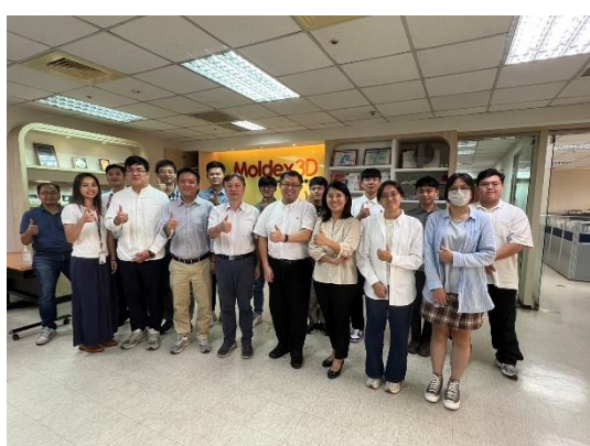
圖六 成果發表會後之大合照