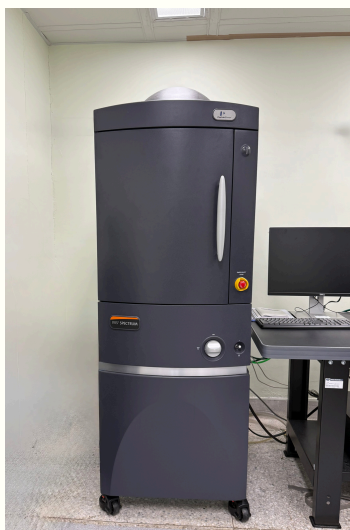
3D活體冷螢光影像系統