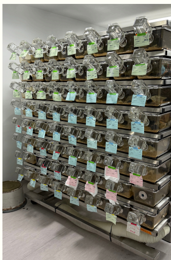
獨立式換氣飼育系統(IVC)