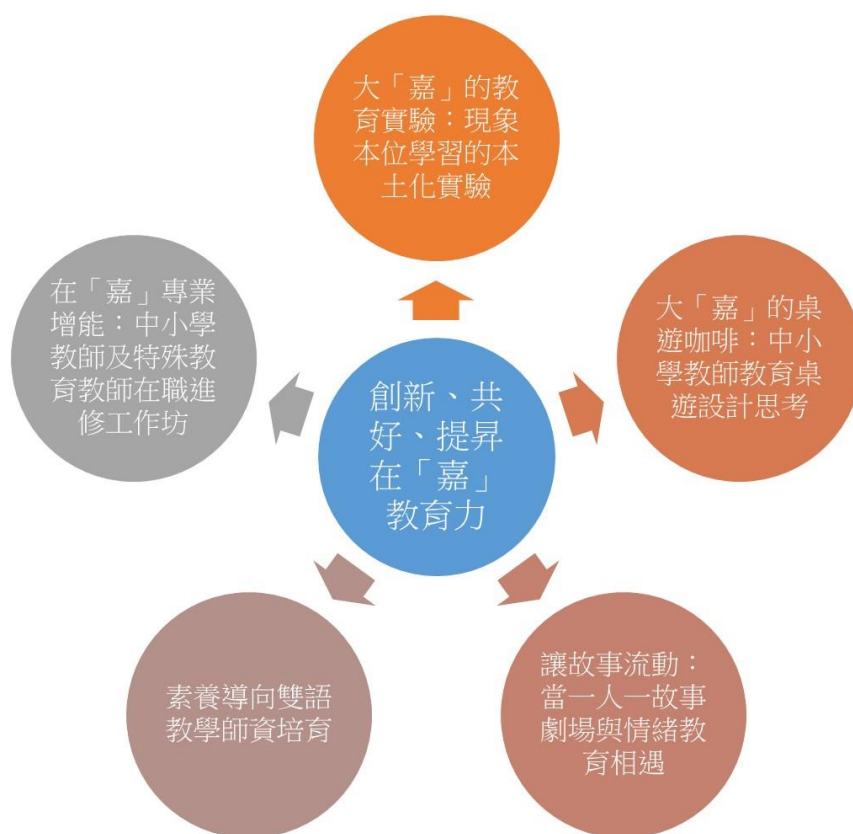
圖4：國立嘉義大學110學年度地方教育輔導工作項目

本計畫將透過長期駐點服務、以辦理在職教師專業增能研習、多元課程學習增能以及本校師資大學教師入校輔導，引導在職教師透過教師社群學習、創新教學模式學習、跨領域交流活動、師資培育大學支持系統等，以期能與十二年國民基本教育課程綱要順利接軌，並發展創新多元的教學實踐能力，本校依照輔導區內學校之實際需求及合作學校發展特色，共訂定五項子計畫如圖4，並在各子計畫內規劃辦理包含增能研習、教師社群、課程共備、人本教育以及教學實踐等各項研習活動。