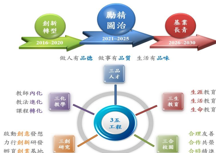
圖1：國立嘉義大學3五工程

自105年度起本校推動「3五工程」計畫，推動15年發展目標（圖1），經由第一個5年（105-109學年度）的淬鍊，持續以「三化教學」、「三創研究」、「三合校園」、「三品人才」、「三生教育」為策略方針，刻正邁向勵精圖治階段。於第二個5年階段，將整合校內資源，與聯合國永續發展目標（Sustainable Development Goals, SDGs）緊密連結，並高度契合本校各項發展面向內涵。