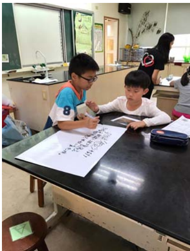
學生小組討論案例。