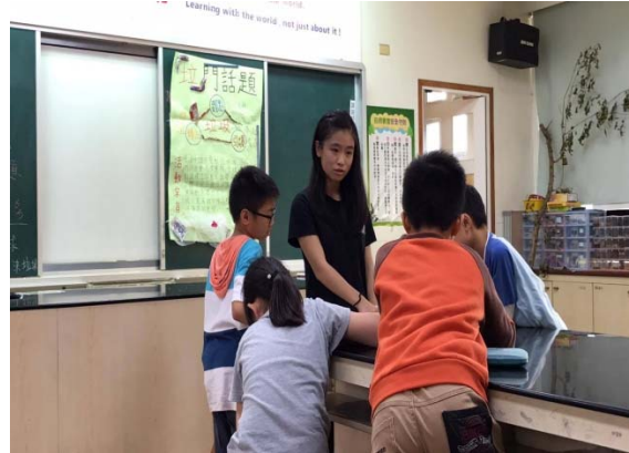
在教師提問引導下，分析案例中的”現象、原因、問題”，能說出其先後順序。