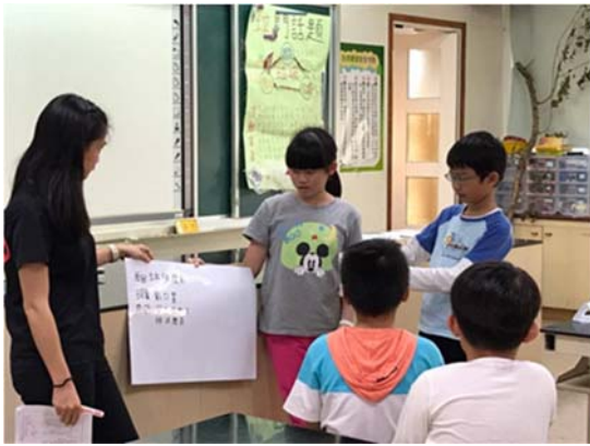
學生上台發表小組討論的案例。