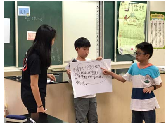
學生上台發表小組討論的案例。