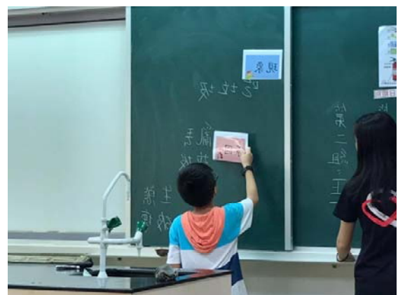
分析案例中的”現象、原因、問題”，能說出其先後順序。