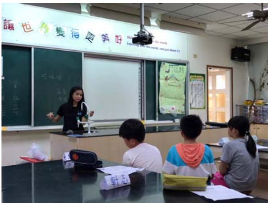
老師將學生的答案記錄在黑板，並依照現象、原因、議題構成架構圖。