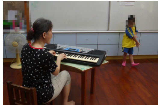
活動四：請幼兒輪流出來表演洗手歌