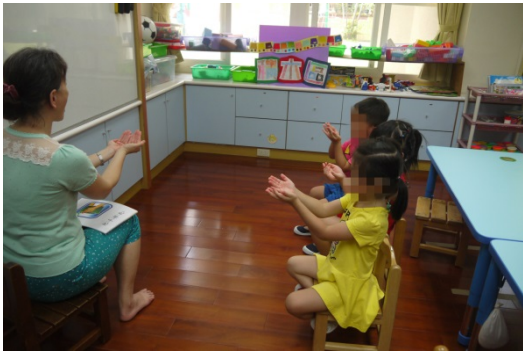
活動三：老師說明每個洗手步驟的語詞