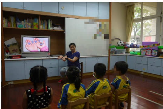
活動二：觀賞洗手影片