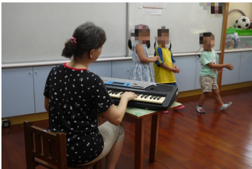
活動四：配合電子琴的歌曲旋律，練習跳洗手歌