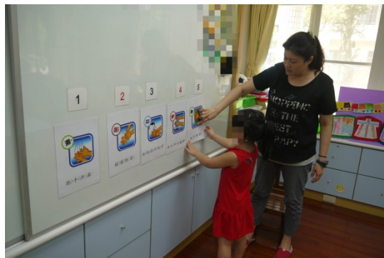
活動三：幼兒練習依照正確洗手步驟，將圖卡排在正確順序上