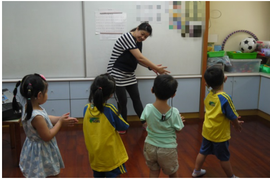
活動四：幼兒跟著老師一邊念歌詞說白節奏，一邊做出動作