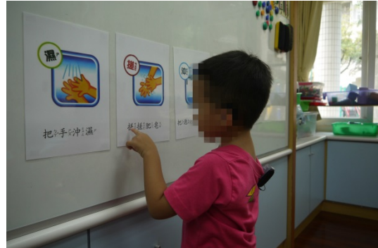
活動三：幼兒輪流進行洗手各步驟圖卡的語詞練習