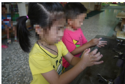
活動二：幼兒實際練習洗手