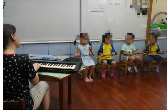
活動四：幼兒聆聽欣賞歌曲的旋律