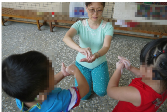
活動二：幼兒跟著老師做洗手的動作，並進行語詞發音練習