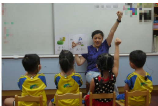
活動二：請每位幼兒輪流進行每張圖卡的發音練習