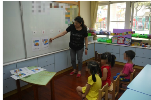
活動三：老師一邊說明洗手五步驟的圖卡內容，一邊排出正確順序