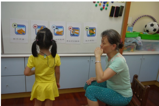
活動三：每位幼兒做聽辨、配對並拿取正確圖卡的練習