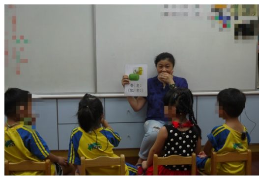
活動二：老師拿出洗手相關圖片，範唸語詞