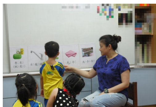
活動二：輪流請幼兒將每張圖卡命名