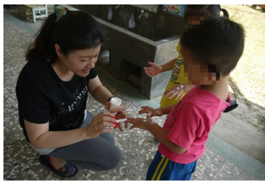
活動二：將白膠沾在幼兒手上每個部位，請他們將這些部位的白膠洗乾淨