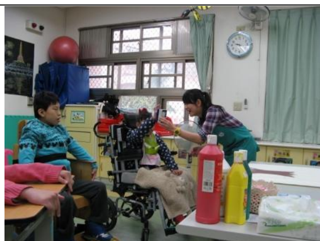
學生用溝通輔具回答