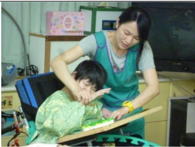
根據學生能力設計手印畫