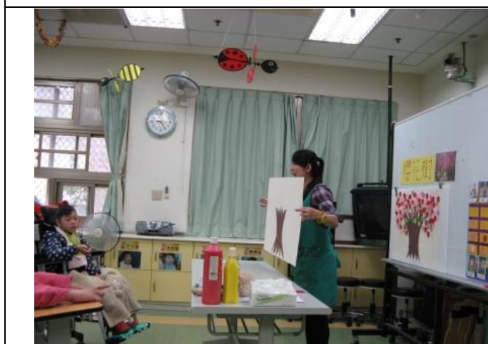
老師說明製作櫻花樹流程