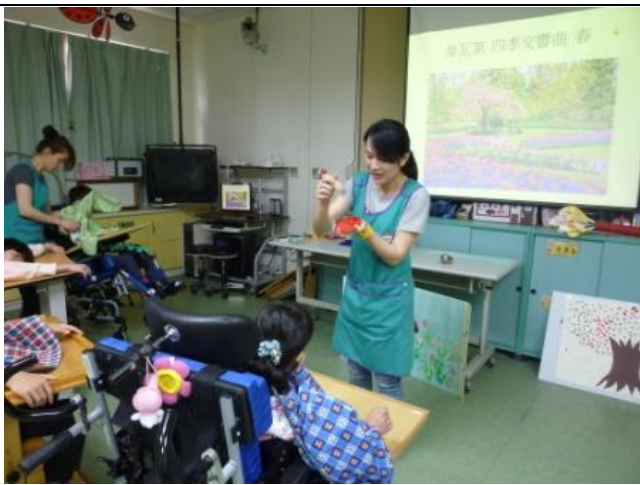
老師示範在瓢蟲上蓋章的動作