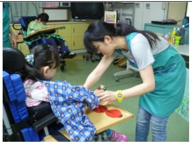
協助學生操作，手部輔以T字帶輔具