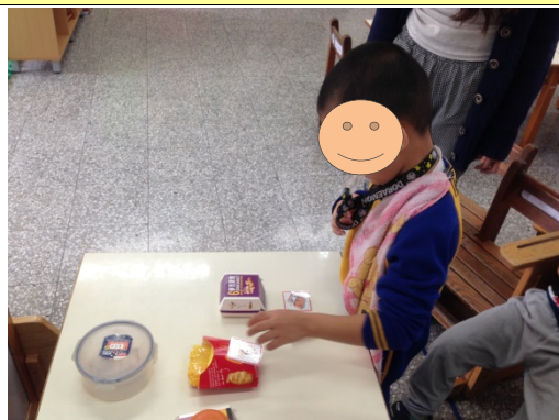
找出麥當勞的食物