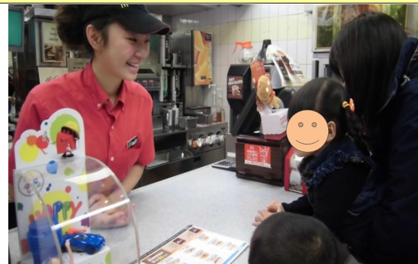
我會點餐(實際情境演練)