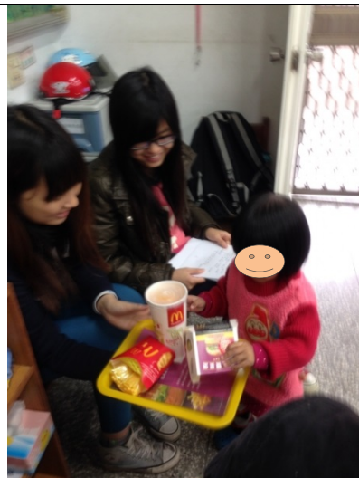
這是我的餐點，分享一起吃