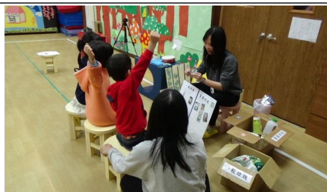
綜合活動： 舉手搶答，完成垃圾黏貼版。