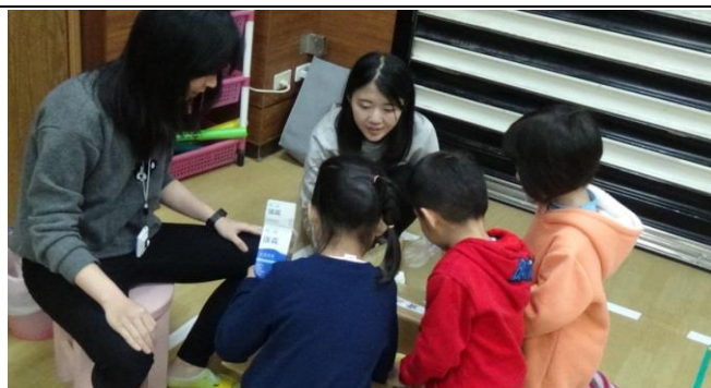
發展活動： 幼兒合作分類一般垃圾與資源回收。