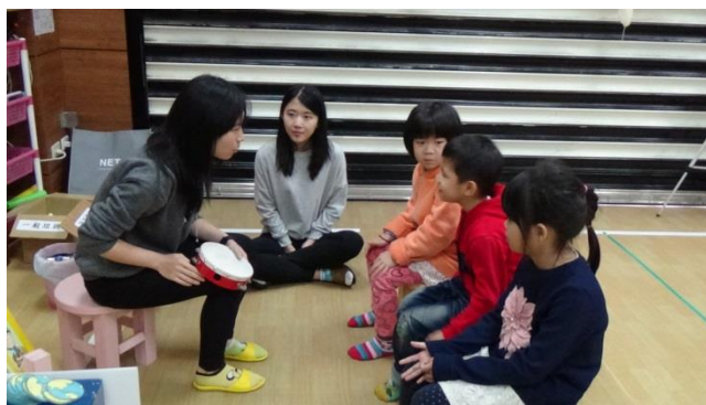
引起動機： 老師利用鈴鼓來點名。