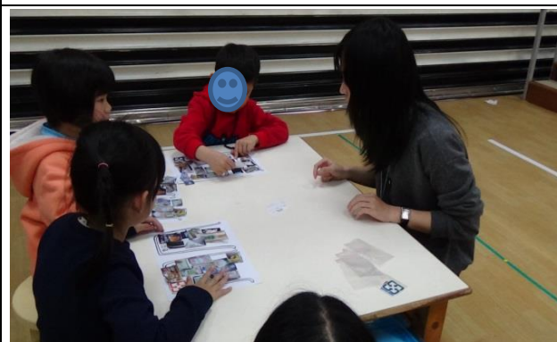
綜合活動： 幼兒完成學習單。