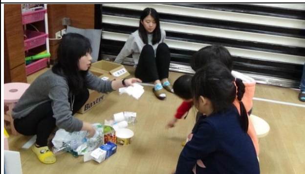
發展活動： 老師介紹常見的垃圾。