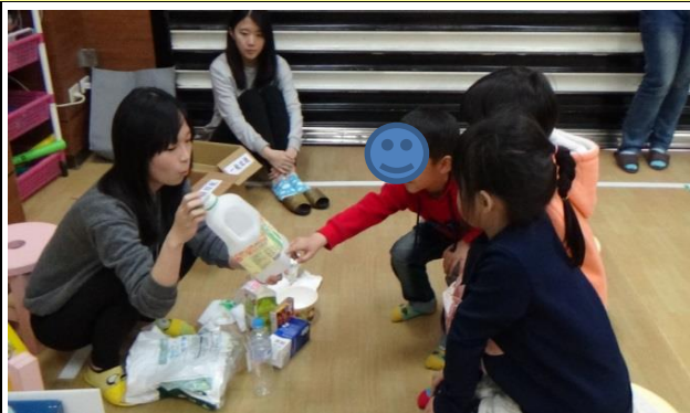
發展活動： 幼兒指認物體上的資源回收標誌。