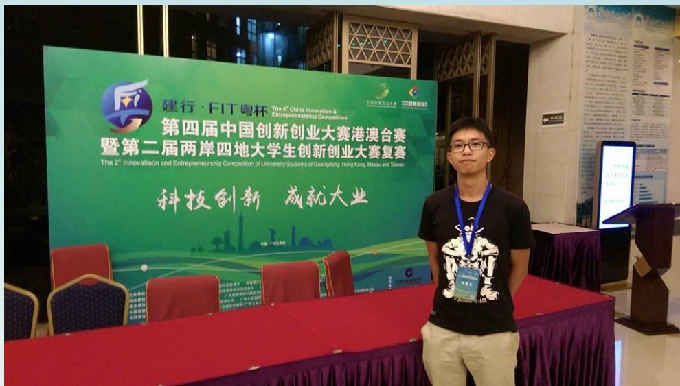
第四屆兩岸四地學生創業賽複賽入圍 (廣州)