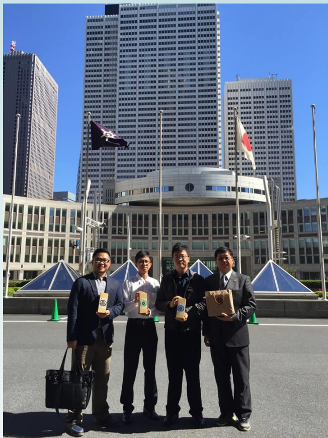
蛋卷博士前進東京市政廳