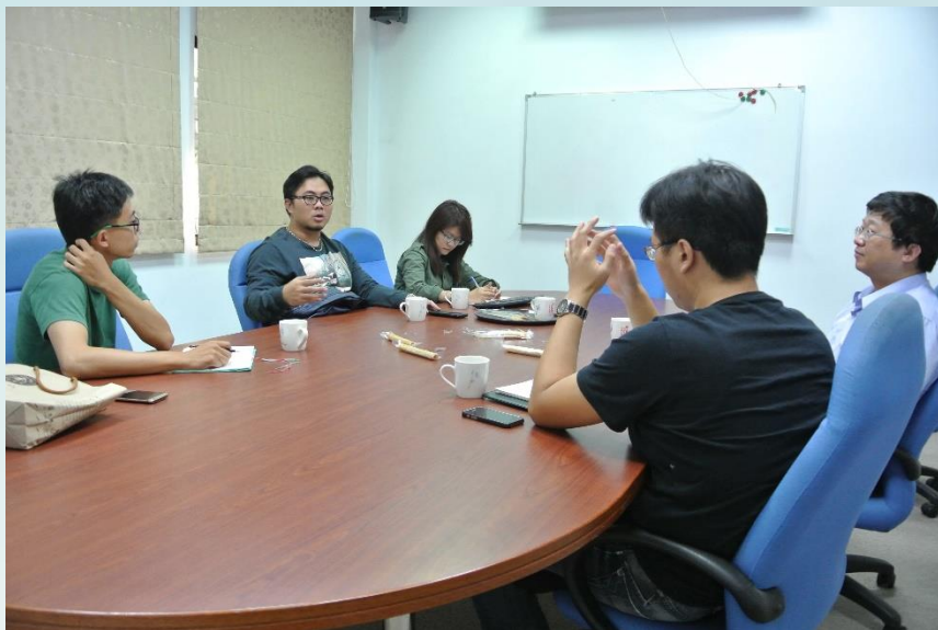
蛋卷博士持續接受中心輔導