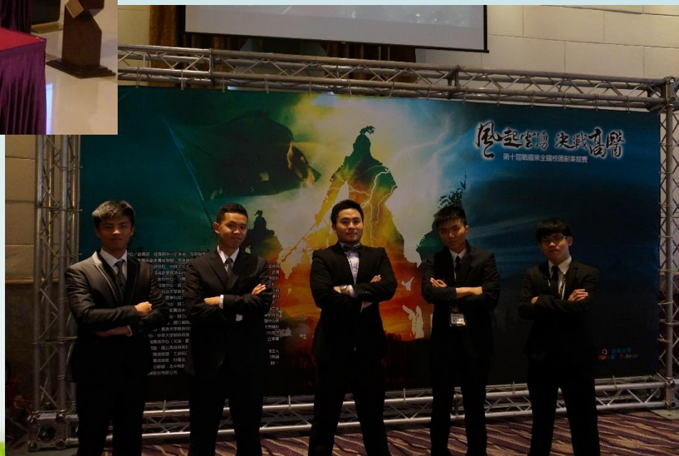
第十屆戰國策創業競賽複賽入圍