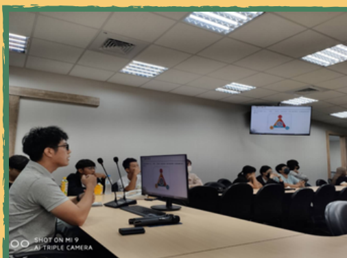
晨光養殖是一間規模很大，屬於公司化的光電養殖場，除了賣魚也賣電，圖片中是由該公司的養殖處同仁介紹他們的營運狀況，之後再前往案場參觀