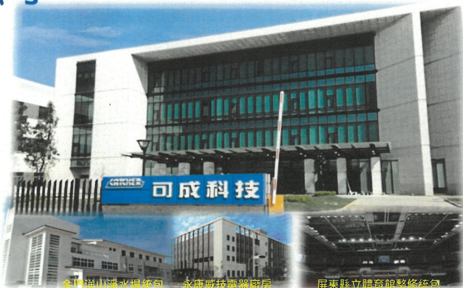
金門洋山淨水場統包