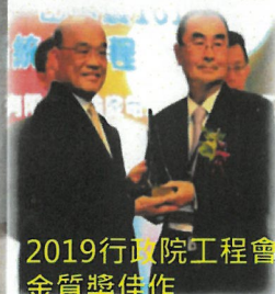
2019行政院工程會 金質獎佳作