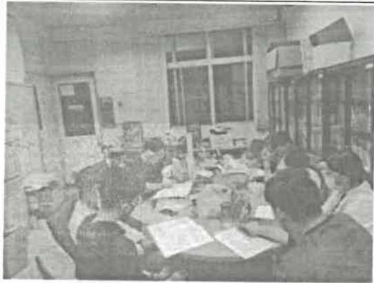
圖三：北宋詩學觀討論