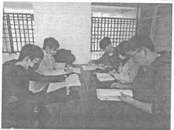
圖四：江西詩派與江湖詩派比較討論