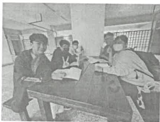
圖五：南宋詩學觀討論