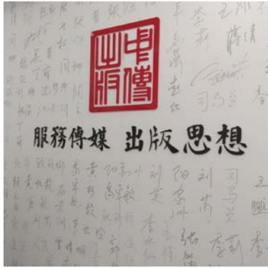
§圖為大門外牆標語