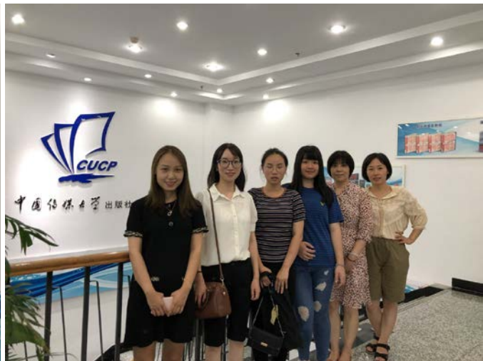
§與本次實習辦公室老師們的合照