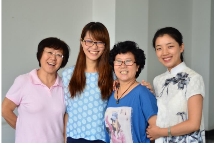
▲與市場中心老師們合影留念(1)