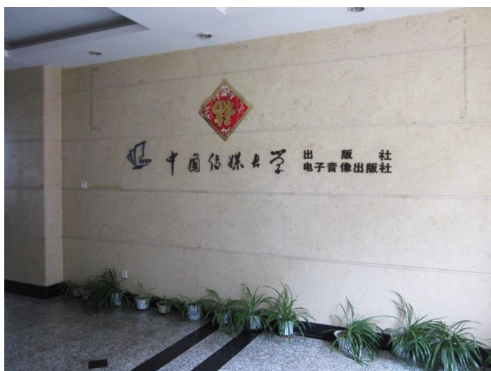
▲ 中國傳媒大學出版社內部