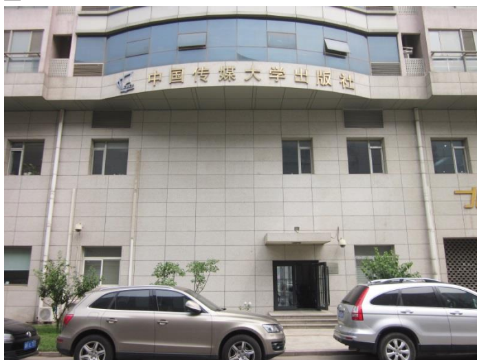
▲ 中國傳媒大學出版社外觀