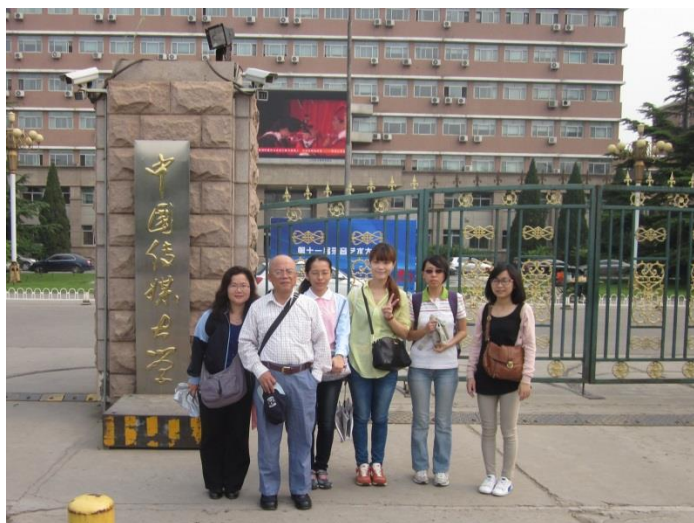
▲ 與康主任、師母及同學於中國傳媒大學南門合影