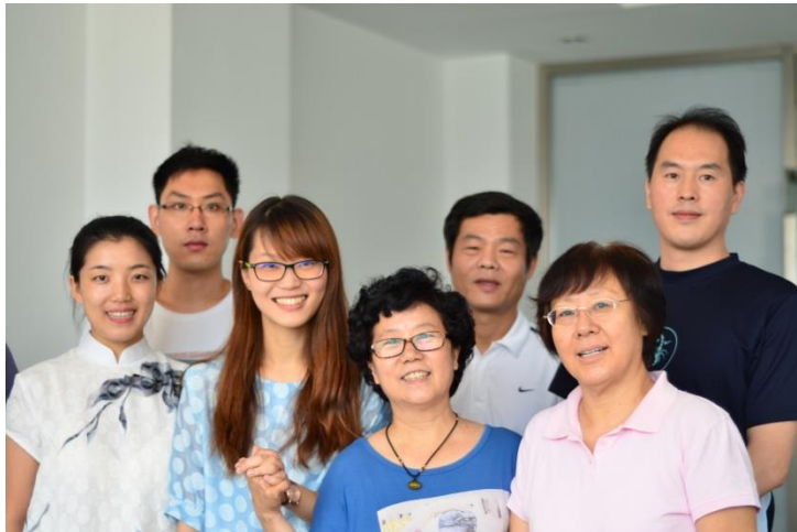
▲與市場中心老師們合影留念(2)