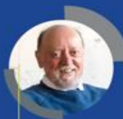
Jack Dongarra Emeritus Professor, University of Tennessee Department of Electrical Engineering and Computer Science