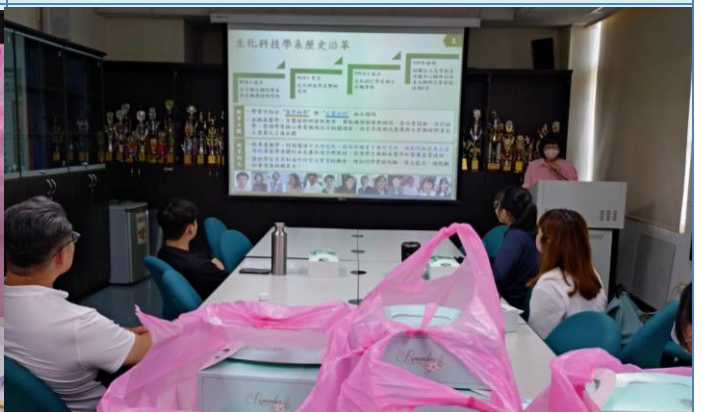
學生認真聆聽開學後注意事項