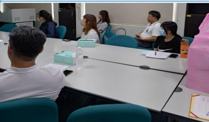
學生認真聆聽開學後注意事項