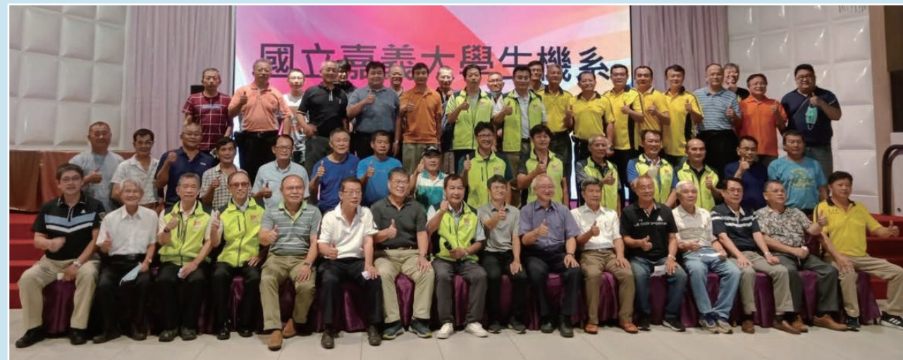
111年08月20日系友會理監事暨歷屆班級聯絡人及母系師長合影留念

今年排除萬難，111年系友會系友回娘家聯誼活動，配合嘉義大學校慶，謹訂於111年11月19日(星期六)舉行。上午10時30分在機電館氣壓教室召開本年度系友會會員大會，會後舉行系友餐敘，餐敘地點在機電館廣場。參加大會及餐會每人收費500元，並贈送紀念品。本會第九屆理監事改選也將與此次會員大會一併舉行，投票時間從上午9時至11時30分止，隨即開票公佈當選名單，並召開第九屆第一次理監事聯席會議，選出本會常務理事、常務監事及理事長，於大會餐敘公佈選舉結果，懇請所有系友會會員踴躍出席參加投票，並歡迎畢業系友踴躍加入系友會，入會費500元/人。系友會秘書處的聯絡電話如下：