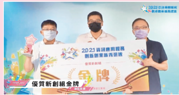
宇安科技「智在嘉鄉，投筆從農」於第九屆資訊應用服務創新創業新秀選拔中獲得「優質新創組金牌」。(摘至中時新聞網)

目前，宇安科技已能於多個縣市同時展開施工及管理案場，並重新找到企業的核心定位，成功由學生團隊轉型為系統商角色的新創公司。