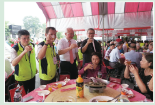
109年系友大會系餐敘現場