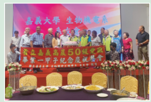
省立嘉義高農50級愛班畢業一甲子紀念慶祝餐會