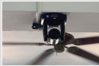
HD自動追蹤視訊攝影機