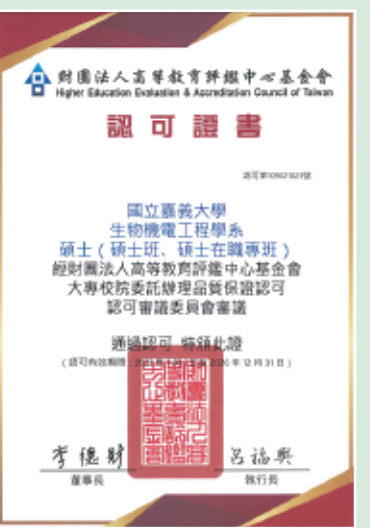
碩士班通過大專校院委託辦理品質保證認可