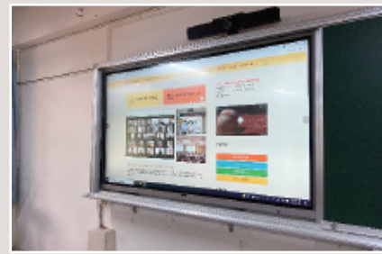
86吋觸控液晶顯示器