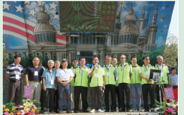
109年系友大會理監事大合照