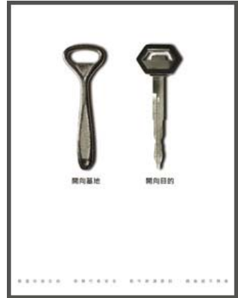
圖 9 喝酒不開車稿