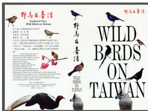
圖 4 王禾 野鳥在臺灣稿

東漢·許慎《說文解字·序》曰：「形聲者，以事爲名，取譬相成，『江』、『河』是也」。按許慎字面的意思：形聲字也是一種組合的字，就是先取字的一部份表示造形符號，然後再取字的另一部份表示讀音聲符，『江』和『河』就是用形聲的方法造出來的。將六書形聲造字觀念，運用於視覺傳達設計，可將創意設計，透過二個或二個以上的實體物件加以組合，其中一個表物的形狀，一個表物的聲響，塑造成一個新的情境；形聲的觀念，運用在創意中，通常能讓畫面充滿著節奏韻律感。形聲造字的觀念，可以用許多圖文設計來驗證，舉例來說，新聞局設計的「台灣野鳥海報稿」就是用形聲組字的觀念來設計的，畫面中有二個主要的物件，一個是字體，一個是台灣野鳥，很明顯地，野鳥是一個會叫的發聲體，通常以形聲觀念來設計的稿件，都充滿了音樂性。