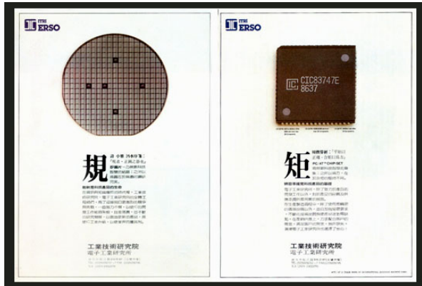
圖 2 工研院電子所 規矩稿

指事造字的觀念，可以用許多圖文設計來驗證，舉例來說，工研院電子所(ERSO)的「規矩」系列稿，就是用指事造字的觀念來設計，將電子所的產品，PC/AT CHIP-SET 和 矽晶圓(WAFER)，透過設計和攝影的巧思，將產品拍攝成正方形和圓形(指事的精神就是簡化的圖形)，本設計的標題「規、矩」堪稱神來一筆；設計師凌明聲在評審時曾說：「『規矩』是中國古時數學畫方圓的工具，與現今的科技產品相互對應，甚為巧妙！」