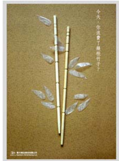
圖 7 保護竹林稿

陳同學在設計此草稿時，考慮到用甲物的形，塑成乙物的狀，讓其具備二種物體的特色來設計；這是一張強調環保、少用免洗筷的稿子，她運用巧思將環保筷設計轉換成象形的竹林，用竹筷代替竹子的本身，用免洗筷的塑膠包裝，剪成塑膠竹葉，整個設計的趣味就出來了，稿子也活了，且讓人耳目一新，使用免洗筷將對竹林造成無情的砍伐，請大家用餐時多用環保筷，勿用免洗筷。