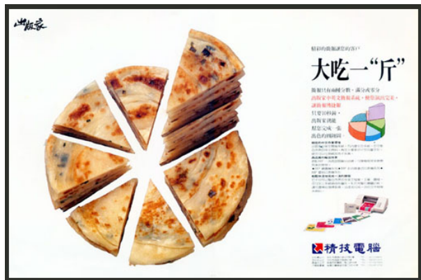
圖 6 大吃一斤 精技電腦形象稿

假借的觀念，最適合用在廣告設計的「文案」上，舉例來說，勞斯廣告替一個軟體公司設計的「大吃一斤」廣告稿，就是用假借造字的觀念來設計，將大吃一「驚」，假借成大吃一「斤」，趣味橫生；本稿將我們日常生活中，在街頭巷尾看到的蔥油餅，做成提案統計專用的圓餅圖，而蔥油餅與圓餅圖又有相當程度的關聯性，有創意又有銷售性！