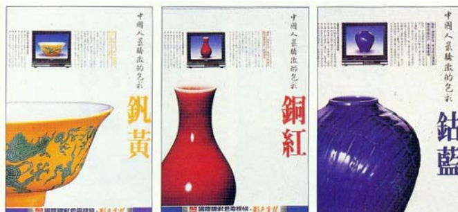
圖 5 時報廣告金像獎 國際彩色電視稿

東漢·許慎《說文解字·序》曰：「轉注者，建類一首，同意相受，『考』、『老』是也」。按許慎字面的意思：「建類一首」，就是指二個以上的字，都擁有相同的一種部首；「同意相受」就是指幾個部首相同的字，都擁有相同或類似的解釋，『考』和『老』就是用轉注的方法造出來的。將六書轉注造字觀念，運用於視覺傳達設計，可用系列設計或系列稿的形式來表達，系列稿的「建類一首」可能建的是架構、也可能建的是色彩、或可能是文字；「同意相受」在系