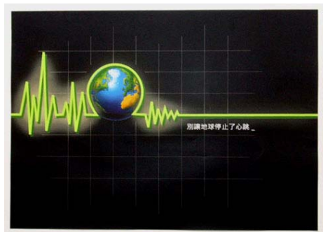
圖 10 地球心跳稿