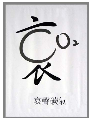
圖 12 哀聲碳氣稿

假借創意觀的特色，就是強調「文案借字」，產生新意的變化，蔡同學設計的「『哀』聲『碳』氣」稿，主題是倡導重視地球暖化議題，希望工廠不要亂排放廢氣，也希望大家少開車，少用冷氣，減少碳的排放量，張同學用假借法設計，巧妙的將「咳(唉)聲歎氣」轉換成「『哀』聲『碳』氣」一語雙關，甚爲巧妙，並且將 CO 2 與「哀」結合，讓人從畫面一目了然，大家如果將來不想「咳(唉)聲歎氣」，那現在就要做好「節能減碳」！