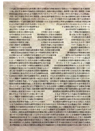
圖 8 京都議定書說多做篇