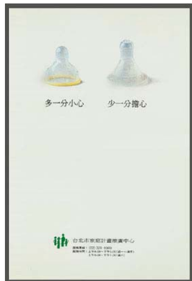
圖 3 何清輝 家庭計劃稿

會意造字的觀念，可以用許多圖文設計來驗證，舉例來說，黃禾廣告何清輝設計的「家庭計劃稿」，就是用會意組字的觀念來設計，會意就是用二件物品放在一起，形成一個新的意義，何清輝巧妙的用奶嘴和保險套作對比排列，讓人一目了然，了解保險套與奶嘴的延伸關係，而達到