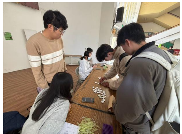
圖(六)活動組拼圖大賽