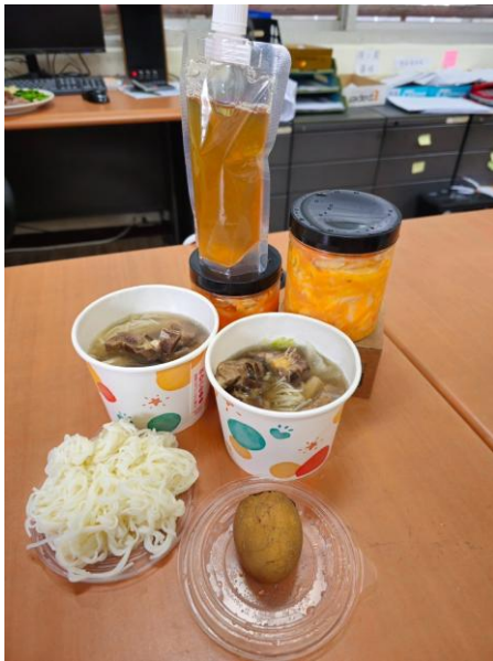
圖(三) 康普茶、泡菜、藥膳排骨、茶葉蛋