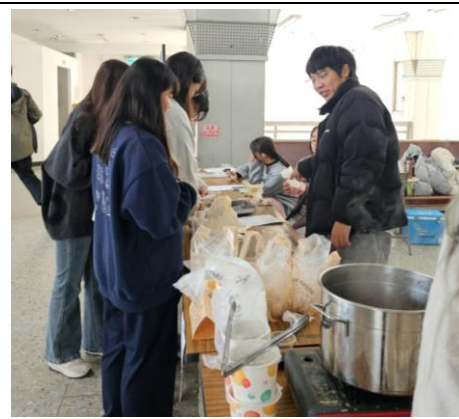
圖(二)藥膳排骨販售