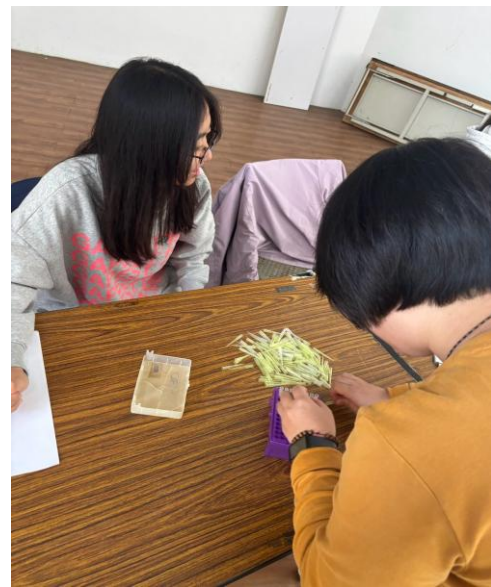
圖(四)活動組補 tip 大賽