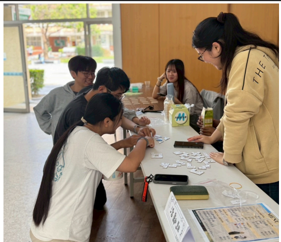
圖(六)活動組拼圖大賽