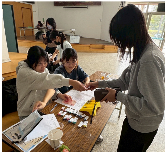
圖(四)收銀組兌換商品卷