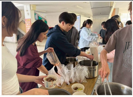
圖(二)藥膳排骨販售