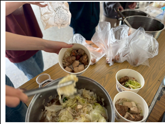
圖(一)藥膳排骨、茶葉蛋