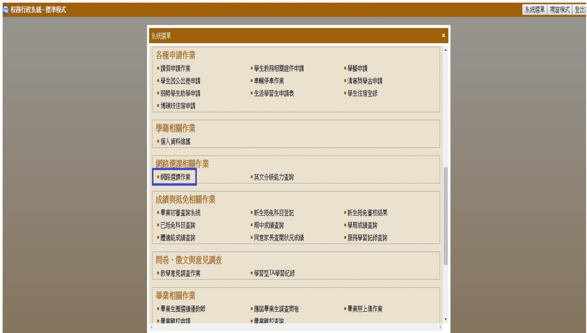
圖三：開啟「網路選課作業」